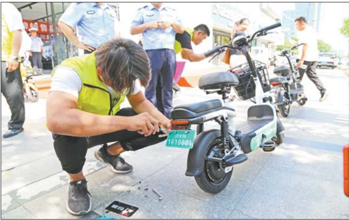
“济南1610001”,9月18日上午,济南市首辆带牌销售电动车售出。