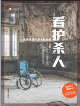
《看护杀人》 [日]每日新闻大阪社会部采访组 著 石雯雯 译 上海译文出版社