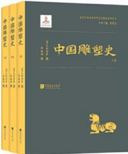
《中国雕塑史》 [日]大村西崖 著 范建明 译 中国画报出版社

也许正因为梁先生较早言及这些海外学者及其著述,我国学界至今仍将大村西崖的《中国雕塑史》和常盘大定、关野贞合著《中国文化史迹》,以及沙畹《华北考古记》、喜龙仁《五至十四世纪的中国雕塑》看作是中国古代雕塑美术的“四大名著”。尤其是大村西崖的这部著作,从研究著述角度来讲,堪称最早的中国雕塑史专著。