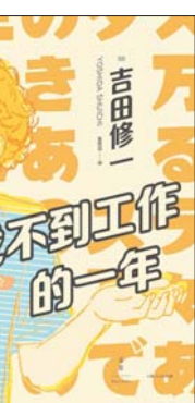
《找不到工作的一年》 [日]吉田修一 著 覃思远 译 上海人民出版社

今年一月下旬,在老家结束延长的春节假期,我平安返回上海住处,开始居家隔离生活,编辑部二月上旬开始全体在家办公。在家中收拾好工位,开始审读工作,也开启了有世之介陪伴的日子。《找不到工作的一年》,十二个月的时光,我和世之介还有他身边那些朋友们一起,走过樱花飞舞的四月、充满倦怠的五月、梅雨放晴的六月、泡在湛蓝池水的七月……直到翌年三月的重新启程。托他们的福,在魔幻的2020年,我也有幸经历了温暖的四季。