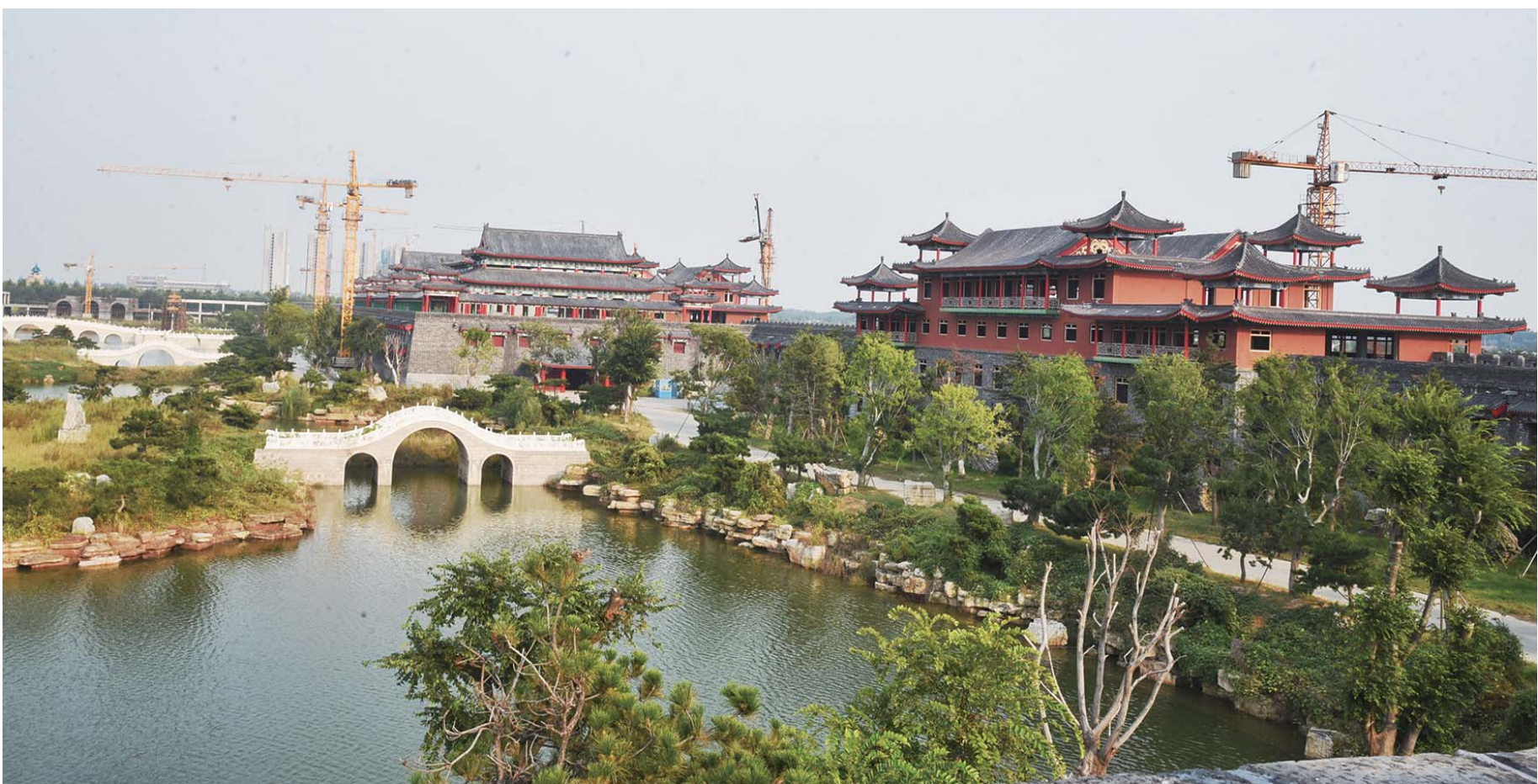
正在建设中的齐河博物馆群。

时维九月,序属三秋,正值德州大地一派丰收之时。9月22日,备受瞩目的首届德州市旅游发展大会在齐河县召开,这是德州文旅高速发展的一次精彩亮相,是集中展示德州开放、包容、自信面貌的重要窗口,来自五湖四海的嘉宾同聚于此,共襄盛举。