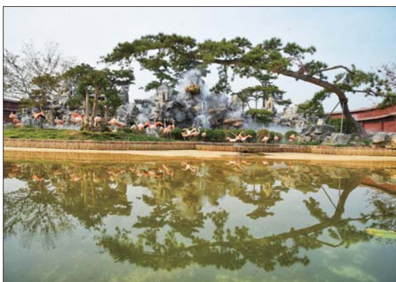
泉城欧乐堡动物王国如梦如幻。