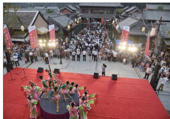
泉城中华饮食文化小镇节目精彩纷呈。