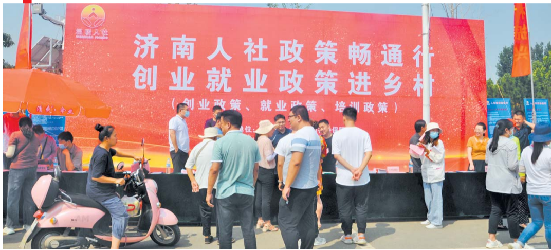
济南市人社局组织开展“人社政策畅通行”创业就业政策进社区活动。

脱贫攻坚工作开展以来,在济南市委、市政府的坚强领导下,全市人社系统始终把精准扶贫作为最大的政治任务和第一民生工程,围绕就业扶贫、技能扶贫、社保扶贫、贫困家庭子女“五免一享”等重点,强力助推人社扶贫工作有效开展。