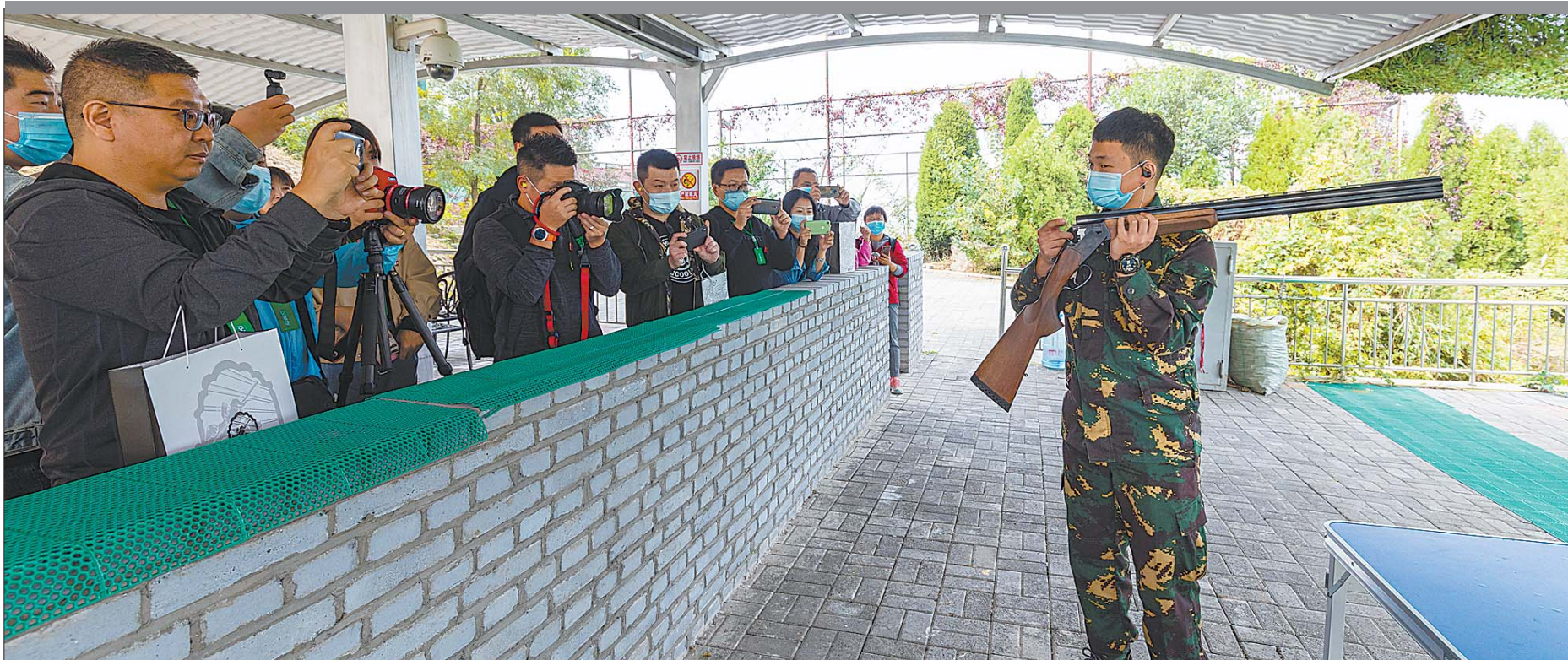
专业教练教授辅导射击技术。