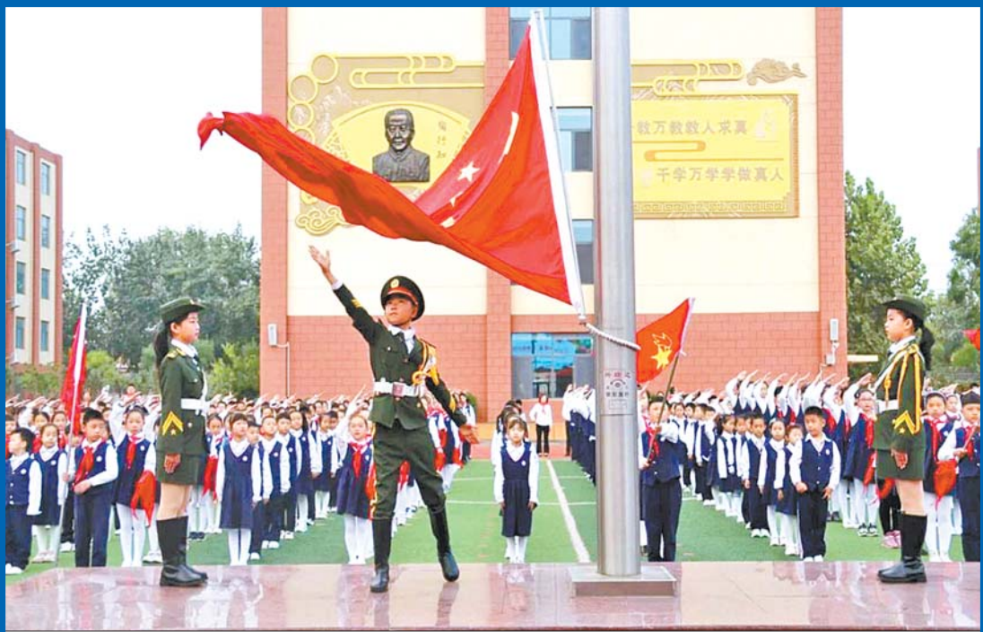
少先队“英雄中队”举行升旗仪式。