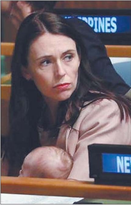
阿德恩带着孩子参加会议。(资料片)

执政三年的新西兰“80后”女总理杰辛达·阿德恩将迎来一次大考。17日,新西兰将举行一年一度的国会选举,此次选举原定于9月19日举行,但受新冠疫情影响而被推迟。争取连任的阿德恩能否如愿,成为此次选举的一大看点。