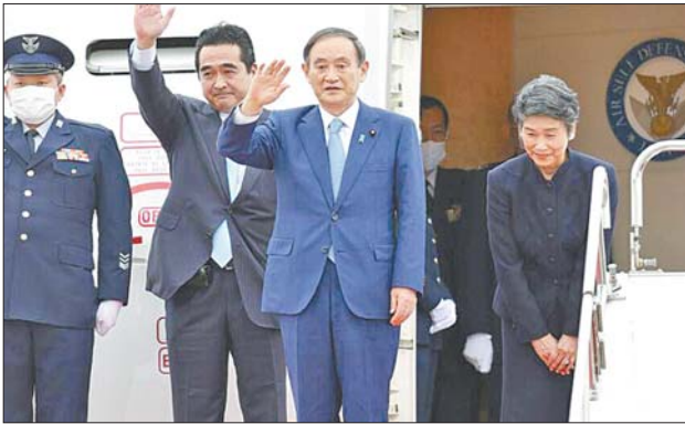
18日下午,日本首相菅义伟从东京羽田机场出发前往越南和印尼,开启上任后的首次出访,其夫人真理子(右一)一同随行。