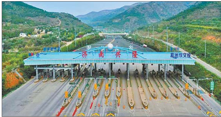
济泰高速兴隆收费站。

因为济泰高速位于南部山区与泰山余脉之中,工程桥隧比高达70%,新建隧道5座(涝坡隧道、海螺岭隧道、小佛寺隧道、柳埠隧道、长城岭隧道)、互通立交3处(涝坡互通、锦绣川互通、柳埠互通),桥