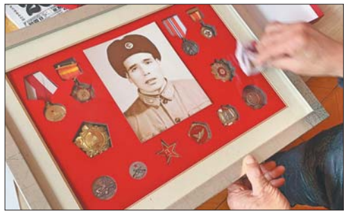
勋章——戎马一生的象征,也是他最珍贵的纪念。