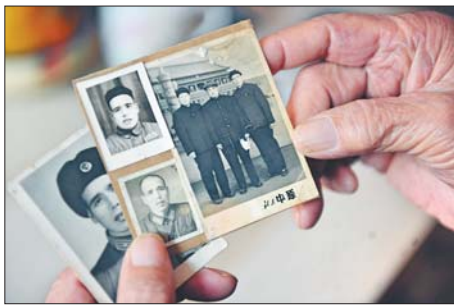
老照片里,有不少他年轻时候和战友的合影。