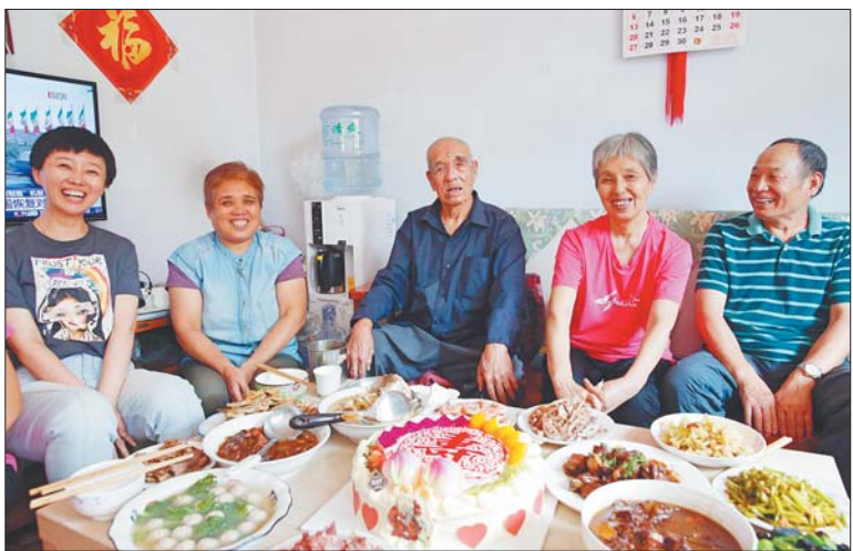
百岁生日,家人们在为他庆生。