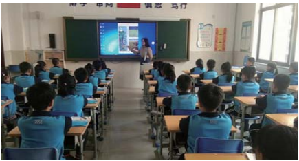
课堂评比 为加强学生良好学习习惯的养成,近日,明珠小学开展了“微课堂习惯展示”评比活动。(王子琦)