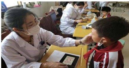
健康体检 为促进学生健康成长,近日,新都小学对学校1600多名学生开展了为期3天的全面健康体检活动。(陈胜男)