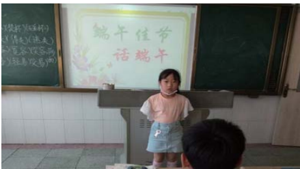
端午情 为使更多地了解中华民族传统节日的文化内涵,近日,经区实验小学举行“端午情 民族魂”系列活动。(郭萍 刘妍娟)