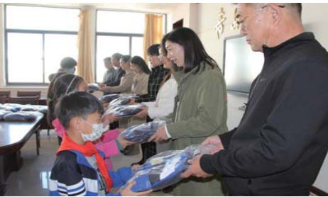
“衣”路同行 为进一步在全校师生中倡导和弘扬“奉献、友爱、互助、进步”的志愿者精神,发挥党员模范带头作用,近日,青岛路小学开展了“‘衣’路同行”党员捐赠活动。(张巧梅 韩旭)