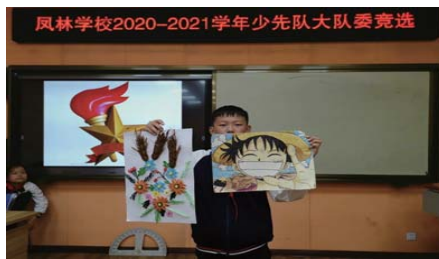
竞选 为增强少先队员的参与意识、民主意识、竞争意识,近日,凤林学校少先队大队部在建队日举行了“我骄傲,我是少先队员;我自豪,争当凤小领头雁!”大队委竞选活动。(刘文君)