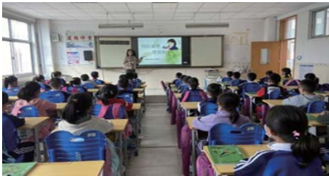
预防流感 为进一步做好流感防控工作,近日,长峰小学开展“预防流感,健康相伴”主题班会活动。(王贝贝)