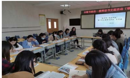
现场交流 为营造浓郁的研究氛围,促进教师的专业成长,近日,长峰小学语文组举行“第一季主题精文共读”现场交流活动。(李琳)