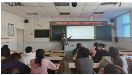
专题讲座 为了更好地落实经区教研中心基于课程标准的“教学评一致性”课堂教学研究,近日,蒿泊小学开展了基于“教学评一致性”的主题单元整体备课的专题讲座。(车路琰)