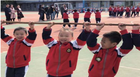
习惯养成展示活动 为更好地强化学生“八会”学习习惯的养成,推动核心素养在课堂教学中的有效落实,近日,长征路小学开展了“八会”学习习惯养成展示活动。(刘丽 鲁慧美)