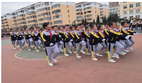
队列队形比赛 为了进一步推进阳光体育的蓬勃发展,树立“健康第一”的观念,增强学生体质,近日,蒿泊小学举行队列队形比赛活动。(岳小好 宋胜男)