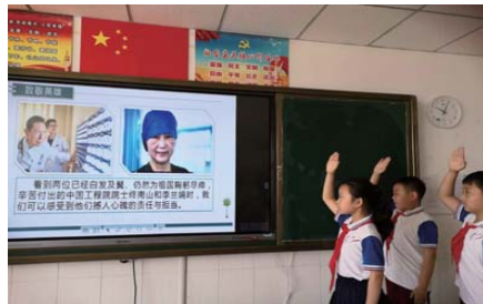
敬畏生命 近日,新都小学开展以“敬畏生命,勇于担当”为主题教育活动。通过敬队礼、绘制手抄报等方式表达对白衣天使的敬意。(张译员)