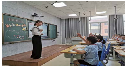
展示课 为提高新教师专业技能,近日,经区实验小学九龙湾校区开展新教师展示活动。(王瑞瑞)