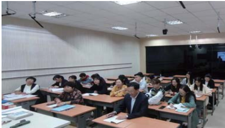
专题培训 为了提升青年教师队伍的教学能力,助力青年教师成长。近日,凤林学校开展了“遇见最美的自己”青年教师课堂教学管理专题培训活动。(王倩茹 马文秀)