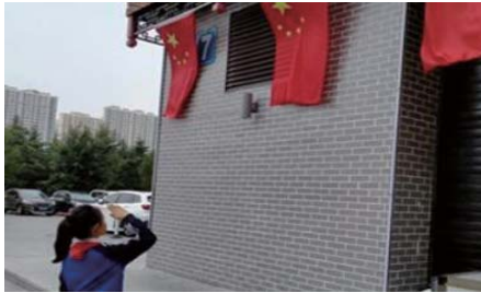
向国旗敬礼 近期,长峰小学开展“情满中秋,欢度国庆”的爱国主义主题月活动,引导未成年人强化爱国意识,激发报国志向。(毕铭珊)