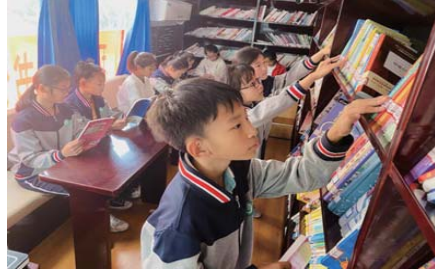
流动图书馆 近日,满载2000多册图书的流动图书馆来到千山路小学,进行为期两天的图书进校园服务活动。(徐连超)