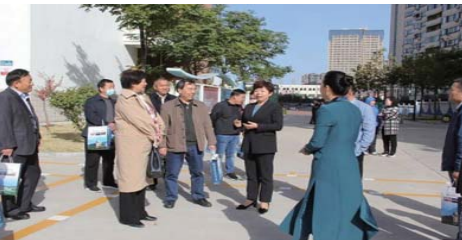
参观交流 近日,青岛路小学迎来了枣庄市校长及骨干教师影子培训团队,共同研讨交流特色学校建设。(韩旭)