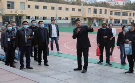
考察交流 近日,枣庄市校长和骨干教师一行来塔山中学进行交流学习。原芳校长向培训团整体介绍了学校发展情况、校园文化、学校特色建设定位。(孙兰婷 周丽媛)