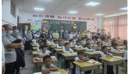
家长开放日 为了让家长亲身经历孩子在校的学习和生活,共同促进孩子健康成长,近日,凤林学校举行了“生命拔节 成长有声”家长开放日暨一年级满月礼活动。(沈正彭)