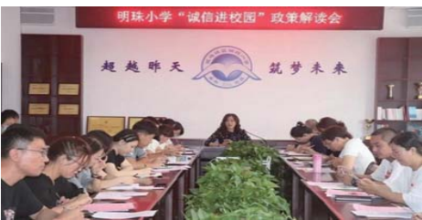
诚信进校园 为加强诚信教育与诚信文化建设,积极推进学校信用体系建设深入开展,近日,明珠小学开展了“诚信文化进校园”系列活动。(林昱秀)