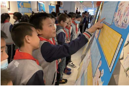
法律进校园 为全面提升少年学生法治意识,推进法治校园建设,近日,温泉开展“法律进校园主题宣讲暨小小法制宣讲员”活动。(刘新伟)