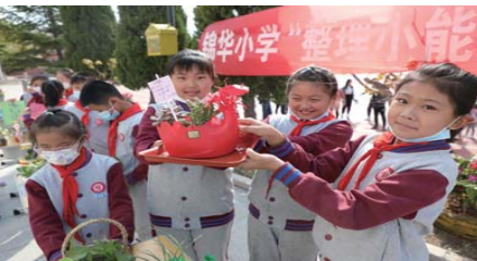
快乐小当家 为引导学生崇尚劳动,尊重劳动,形成正确的劳动价值观,近日,锦华小学开展“快乐小当家,秀出我精彩”劳动教育比赛活动。(孙春玲)