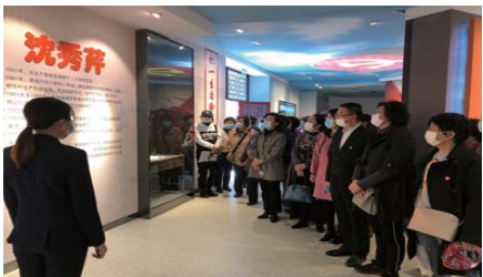
主题党日 近日,长征路小学组织全体党员教师走进红色教育基地——成山林场沈秀芹纪念馆,在重温沈秀芹同志的英雄故事中,接受红色教育洗礼,积蓄前进动力。(王明泉 鲁慧美)