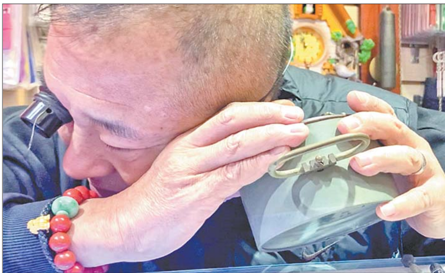
老钟的维修靠听，这是陶良多年修表的经验。