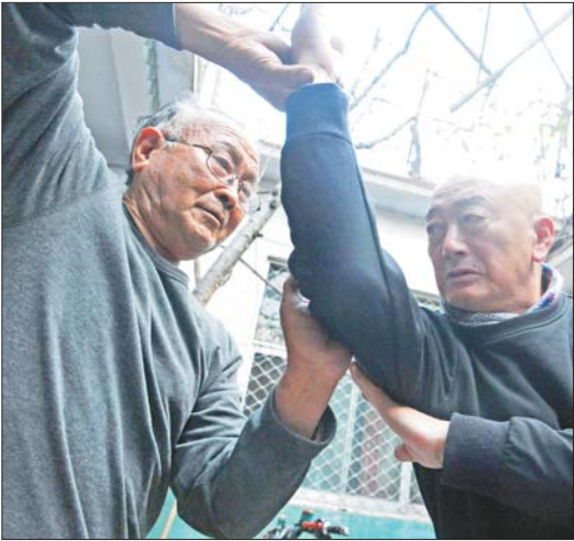
简陋的小院,也是习武的场所。