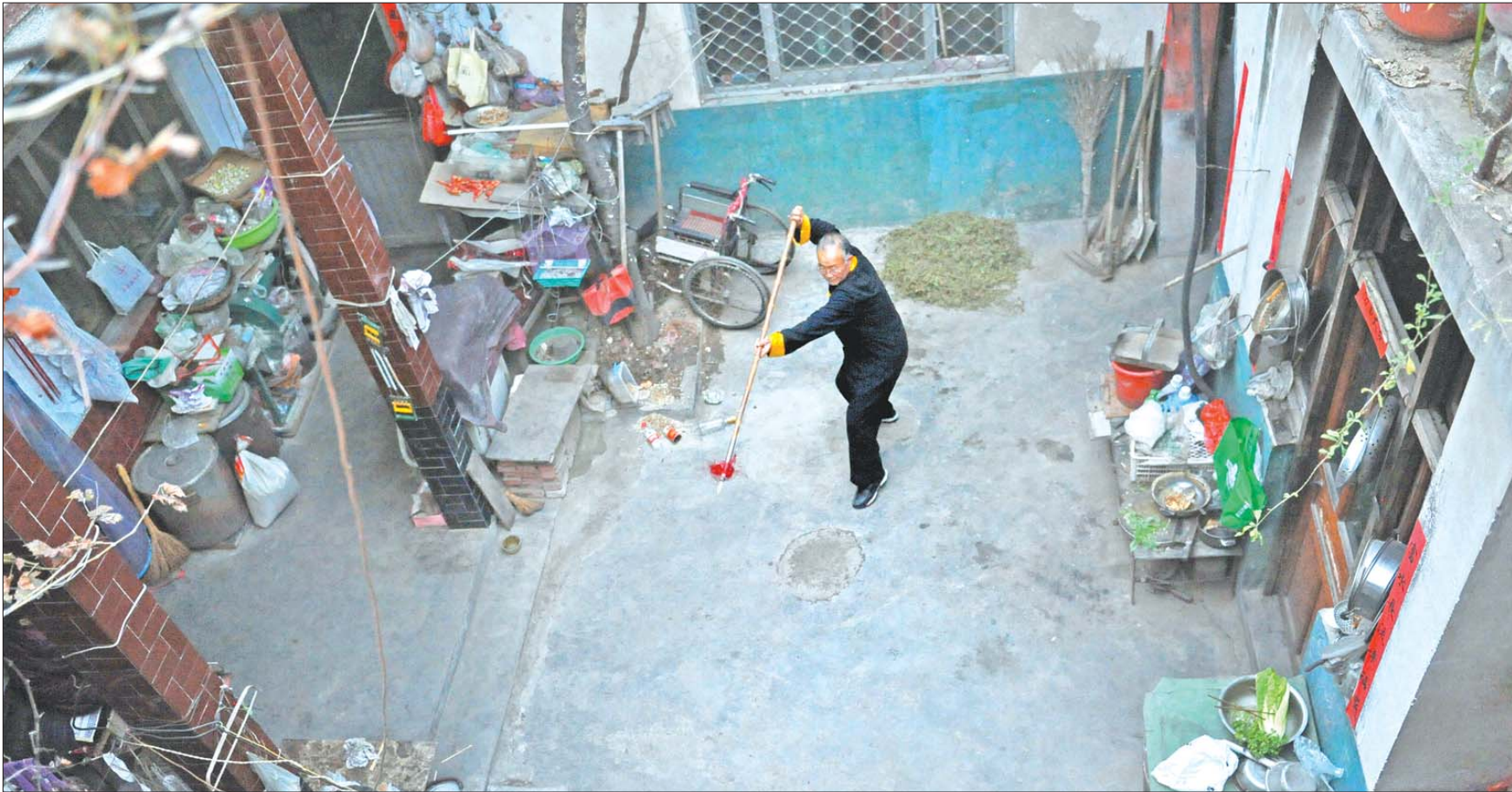
在小院里操练枪械的八旬翁,似乎又找回了几十年前闯荡江湖时的意气风发。