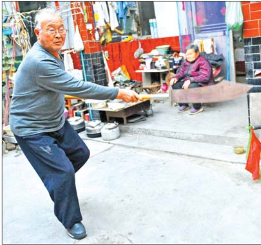
王者训的老伴,永远是他最忠实的观众。