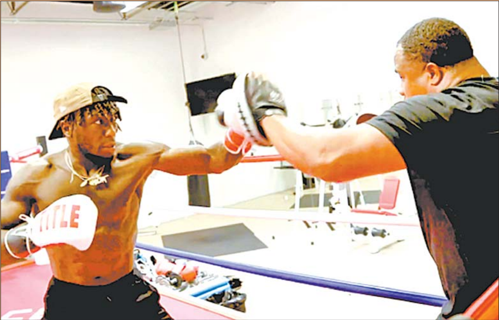
如今罗宾逊改练拳击虎虎生风。

他们离开NBA的原因各有不同,基于个人原因,或者是出于家庭考虑,甚至还有的纯粹是为了追求个人的梦想。当然,有的人转行很成功,但并不是所有人都那么幸运。