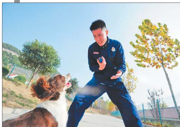
随时培养搜救犬的兴奋度和敏捷性。