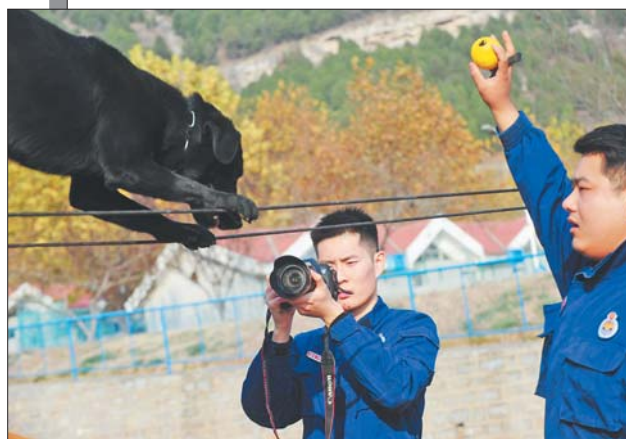
元硕常利用特长，给战友们拍摄制作视频。