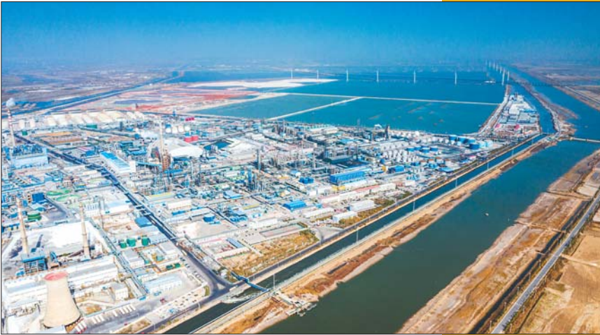
鲁北化工致力循环经济,绿色化工环相扣,整个厂区就是一个循环经济链。