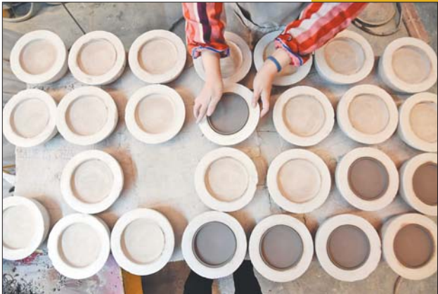
山东海瓷集团的工作人员正在制作胚体,道道工序出精品。