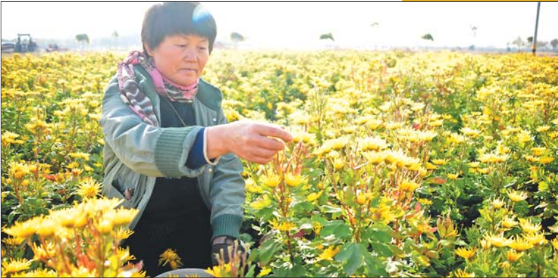
余家镇的花田里,村民正在采菊花,这正是“本草之乡,康养小镇”的脱贫致富路。