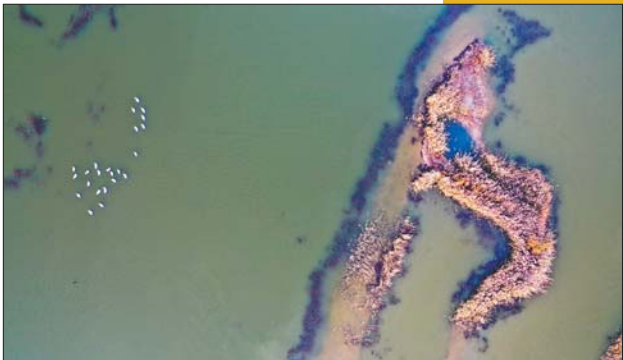
深秋的饮马湖风景独好,湖上天鹅浅游。