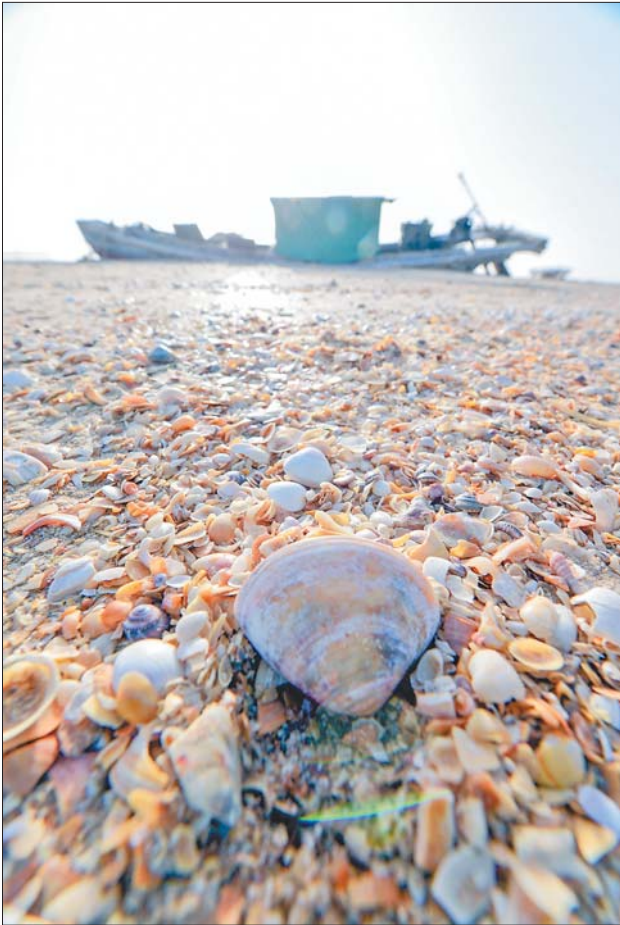
贝壳堤岛。