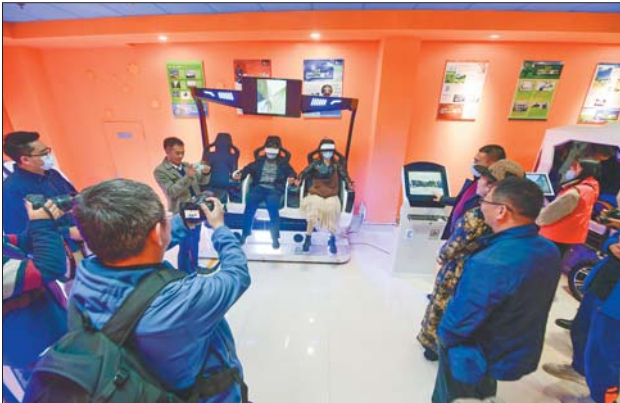
配套设施齐全的无棣新时代文明实践中心。