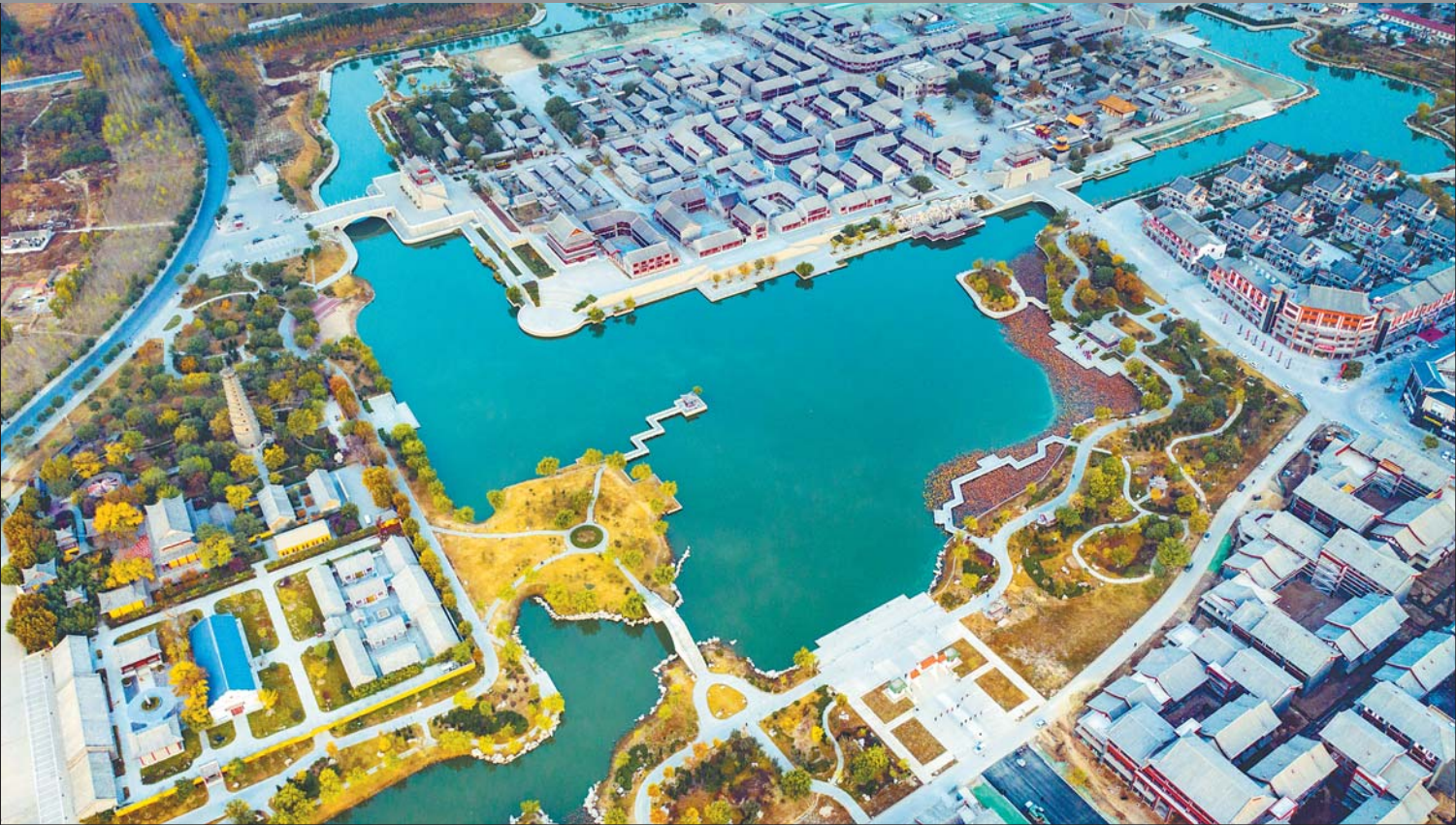
鲁北首邑,水韵古城,听无棣古城千年古风的呢喃。