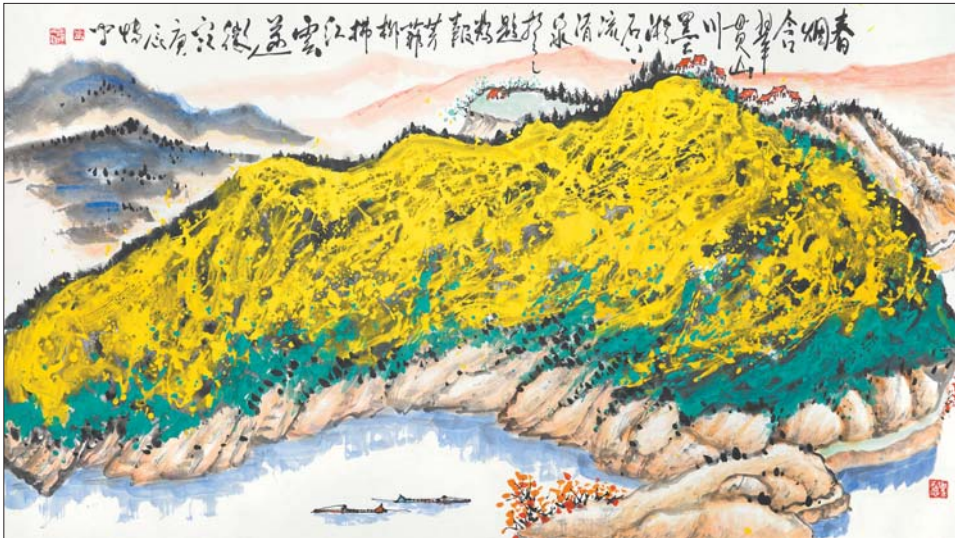
孙博文 春水横钓舟 96x180 纸本水墨 2000年

此次展览分为上篇“时代华章 立传山河”和下篇“淋漓异彩 苍润化境”两个板块,展示孙博文 一生丰富厚重的艺术积淀,重点突