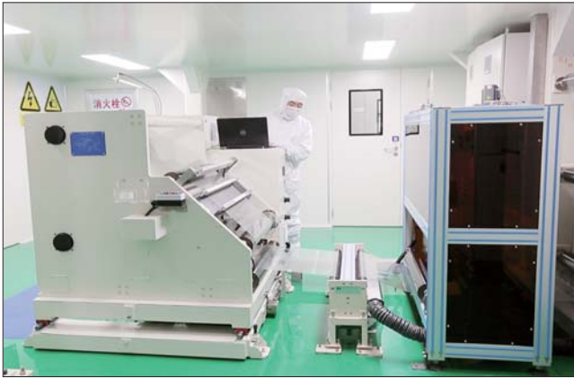
质子交换膜漂亮的生产现场