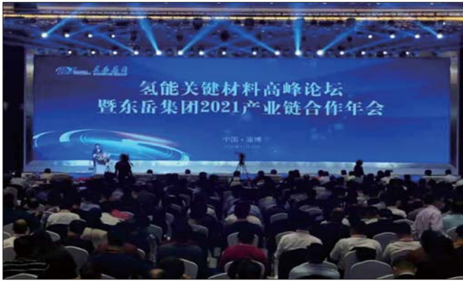
氢能关键材料高峰论坛暨东岳集团2021产业链合作年会成功召开

比较完备的氟硅氢膜产业链条和产业基群,在关键核心领域取得了一系列重大科技创新成果,为民族产业发展,特别是核心技术贡献了东岳力量。现在的东岳综合实力雄厚,管理理念先进,创新成果突出,是淄博转型发