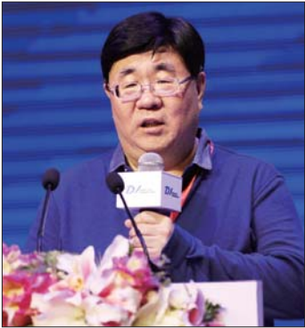
中国石油和化学工业联合会副会长孙伟善