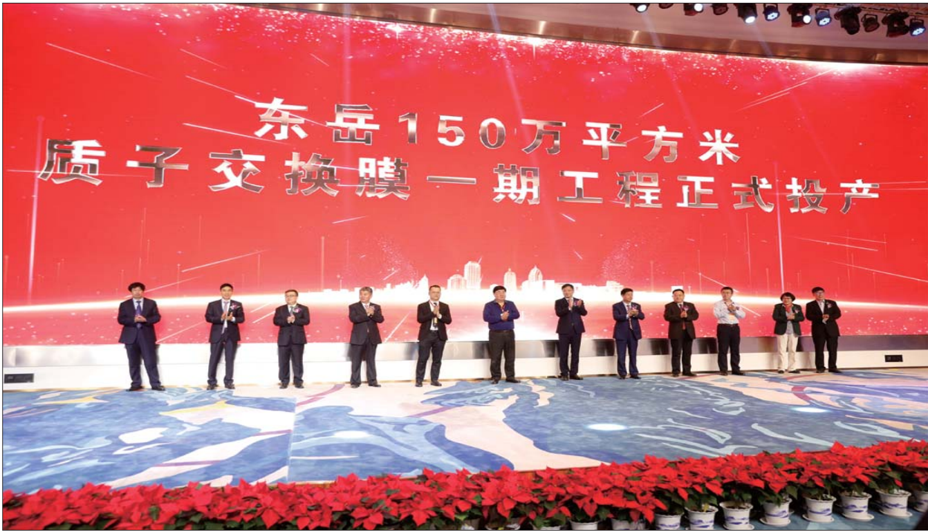
齐鲁晚报·齐鲁壹点记者 樊伟宏 通讯员 于超