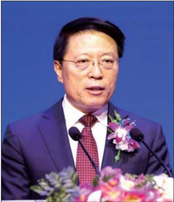
淄博市委书记江敦涛