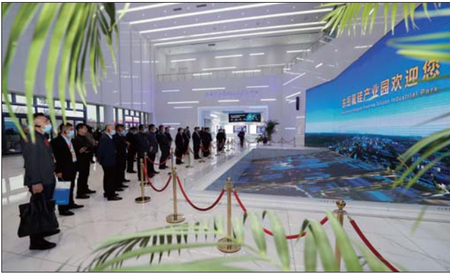
与会嘉宾参观东岳氢能技术示范中心

11月18日,备受关注的东岳150万平米质子交换膜生产线一期工程投产。同日,氢能关键材料高峰论坛暨东岳集团2021产业链合作年会在淄召开。