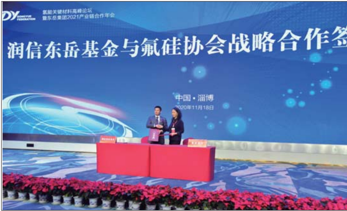
润信东岳基金与氟硅协会战略合作签约仪式

氢能时代已经到来,东岳集团正以勇做高质量发展领跑者的气魄,向着实现“双千亿”,打造世界一流氟、硅、膜、氢创新生态链,张开双臂拥抱氢能时代!