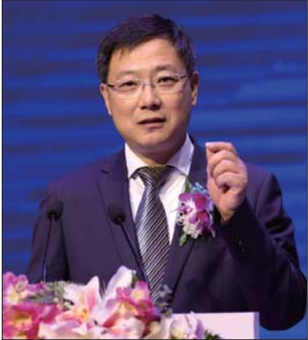
淄博市委副书记、市政府代理市长马晓磊