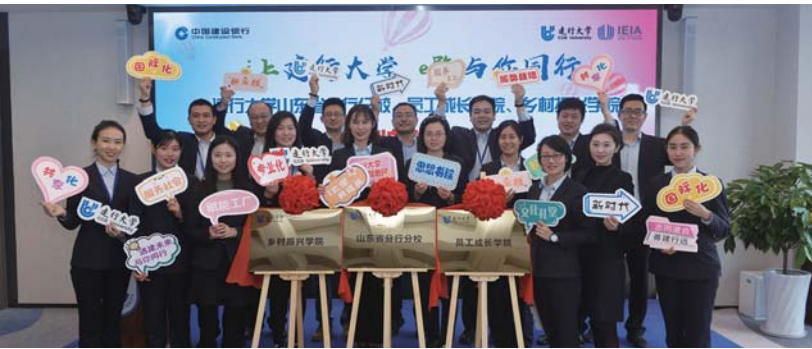
建行大学乡村振兴学院成立。

在依托自主科技平台建设金融服务新生态过程中,建行更注重创新金融,助力民生改善。例如在“裕农通”平台加载政务功能,将服务点变身农村“办事大厅”,推动31类、1913个涉农及村办事项上网运行,让农民体验到“政务就在身边,办事足不出户”。在全省乡村开办代缴社保业务,实现1次扫描(身份证)、1次转账、1分钟办成,累计帮助500万农民缴纳社保15亿元。在城市与卫生健康部门合作建设“智慧社区+互联网医院”,在农村充分利用全省1万家“裕农通+诊所”资源,建设560家“互联网医院+诊所”医联体样板间,帮助城乡居民足不出户体验三甲医院诊疗服务。建设智慧大学,普及金融知识。与省委党校、山东大学、济南大学等高校密切联动,共建产教融合实训基地,举办3300期金智慧民、裕农学堂培训班,为城乡小微企业主、涉农经营主体、乡村干部提供经营管理、脱贫致富和农机农技培训,累计惠及14万人。扩大“劳动者港湾”品牌影响力,与省政协共同开展“泉城暖意·共享书房”“环卫工人爱心歇脚点”公益项目,“港湾”累计服务1120万人次,将“建”与“住”紧密结合,打造住房金融全流程生态圈。系统内首批实现租赁平台省、市两级政府签约上线全覆盖,已入驻企业522家,中介499家,实名注册用户109万户,累计上线房源148万套,线上交易2.2万笔。为山东省最大招商引资项目(威海惠普项目,房源1700余套,可满足6000名员工拎包入住)提供住房租赁贷款,挂牌“建融家园”长租社区12个。将推进住房租赁战略与盘活闲置资产、帮扶困难企业有机融合,积极探索利用自有房产建设青年人才公寓,收储经营困难企业房源建设长租公寓等多种模式,打造优质的住房租赁服务,唱响了“要租房,到建行”品牌。