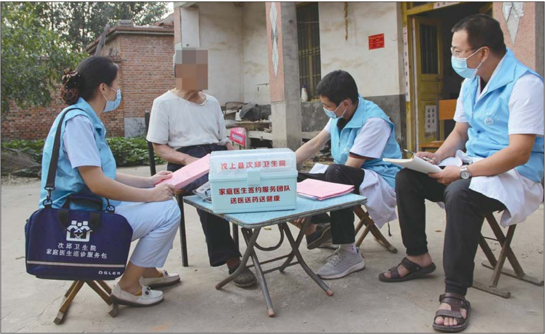
家庭医生入户提供多层次的医疗服务。

抓好健康扶贫,首先要摸清底数做到精准识别,才能“对症下药”。为此,次邱卫生院积极开展家庭医生签约服务,组建29个家庭医生服务团队,为全镇贫困