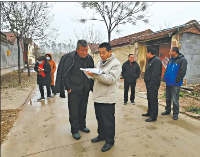
区拆违拆临办公室实地核查督导。

本报12月10日讯(通讯员钱烨 吴汉男) 按照《济阳区2020年拆违拆临工作实施方案》,区拆违拆临办公室于2020年11月25日—11月28日对辖区内七个街(镇)第四季度拆违拆临工作进展情况进行了实地核查督导。全区第四季度违法建设拆除任务数17万㎡,实际上报违法建设台账共计195处、234828㎡,截至目前已拆除161处、150718㎡,拆除率达64.18%,计划于12月25日前全部拆除完毕。 督查组将工作重点放到拆违一线,逐一现场查看,逐一点位核对,经过4天紧张忙碌的实地检查,共巡查违法建设拆除现场86处,涉及拆除面积115243㎡。严格对标拆除工作台账,现场核实上报数据,详细对比拆前、拆后建档立卡资料,了解实际拆除进度,发现问题现场督办,即时给出处理意见,确保将拆违拆临工作落到实处,取得实效。 本次督查,区拆违办全面掌