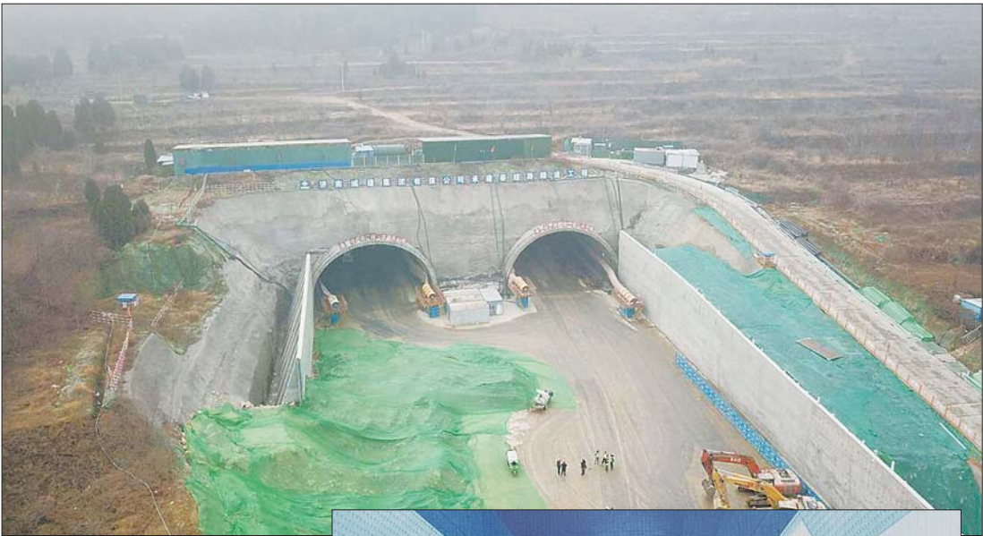
▲施工中的春暄路隧道。

12月11日,齐鲁晚报·齐鲁壹点记者从春暄路(春秀路至经十东路)道路建设工程项目部获悉,目前春暄路下穿玉皇山隧道工程已经从北往南掘进了400余米,隧道部分完成了近四成。春暄路隧道设计为人非机动车道与机动车道隔墙隔离,这在济南道路建设上尚属首次。春暄路建成后,将连接多条道路,服务内陆港片区、自贸区及超算中心等重要片区。