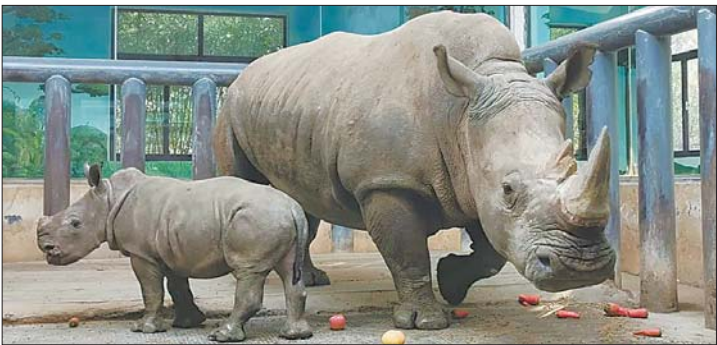
等待大家起名的小犀牛和犀牛妈妈。(资料片)

这只小犀牛身份可有一些不一样,这是双角白犀牛,是现存五种犀牛中个头最大的,体型仅次于大象,共有两个亚种,本次繁育在中国江北地区尚属首例。小犀牛经过犀牛妈妈怀胎16个月才得以降生,在此之前,园区工作人员克服了诸多困难,保证犀牛妈妈