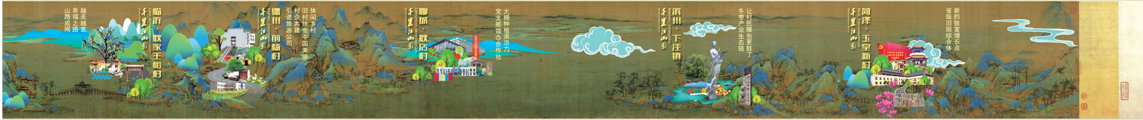
齐鲁晚报·齐鲁壹点《走在小康路上》大型融媒长卷 视觉记者/设计:高峰 牛长婧 马晓迪 文字:齐鲁晚报·齐鲁壹点记者 时培磊