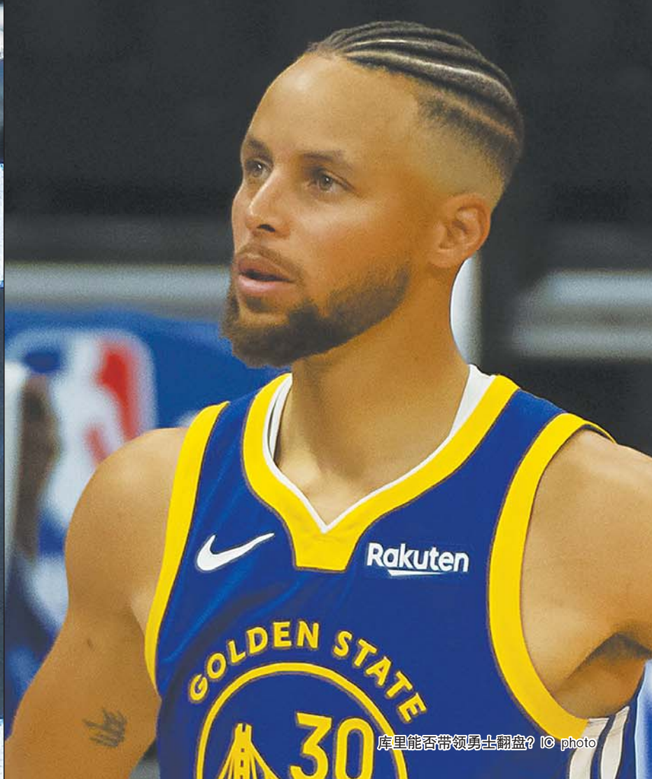
库里能否带领勇士翻盘?

上赛季湖人夺冠的场景还历历在目，转眼间两个月时间过去，NBA新赛季将在12月23日开战。