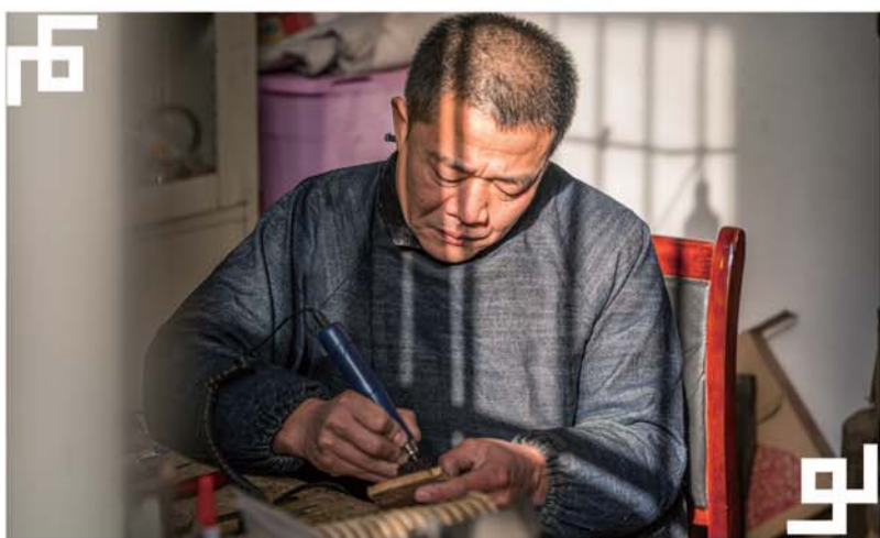
阳光总会给张东波的作品带来生气。