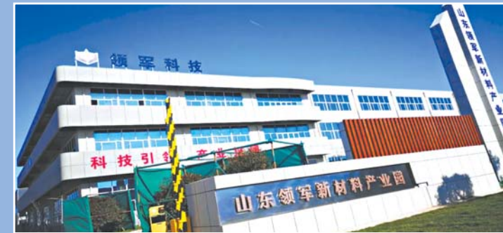
山东领军新材料产业园