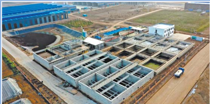
济南大蒜产业新旧动能转换示范园