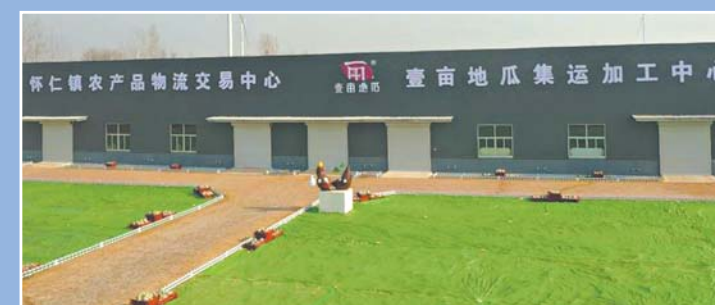
壹亩地瓜物流集运中心项目