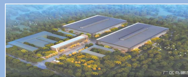
山东润星机械有限公司电控柜及塔式起重机生产项目