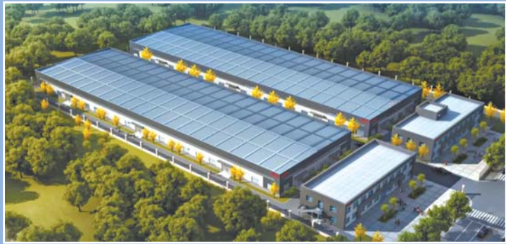
朗威跑步机和哑铃凳生产基地项目效果图