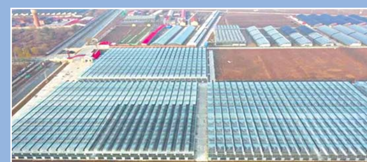
鑫鑫田园花卉产业园项目