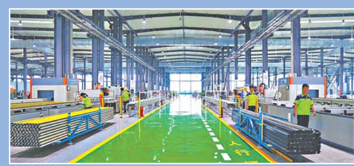
中建八局建筑科技(山东)有限公司产业园区一期已投产