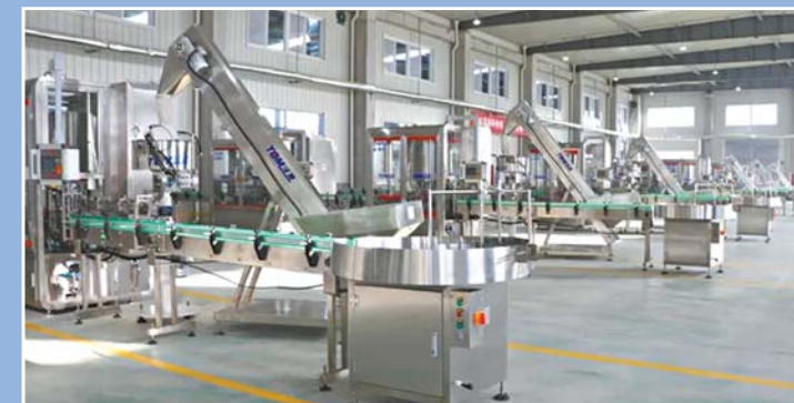
山东奥坤作物生物农化科技产品项目

坚定不移抓好双招双引,加快推动签约项目落地开工,积极引进新项目,为主导产业崛起成峰、跨越发展注入源头活水。要切实加强项目施工管理,强化施工安全管理,大气污染防治和疫情防控安全,奋力开创商河经济社会高质量发展可持续发展新局面。