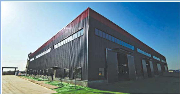
济南亮工智能科技有限公司自动化仪表项目