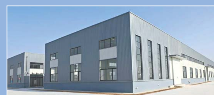
圣恩(济南)新材料项目