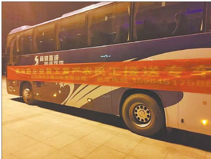
启动复工企业人员返岗定制包车服务,助力复工复产。

车”定制服务,根据学生需求,调度车辆、安排出行,切实做好疫情期间大学生复学复课后的出行保障服务。