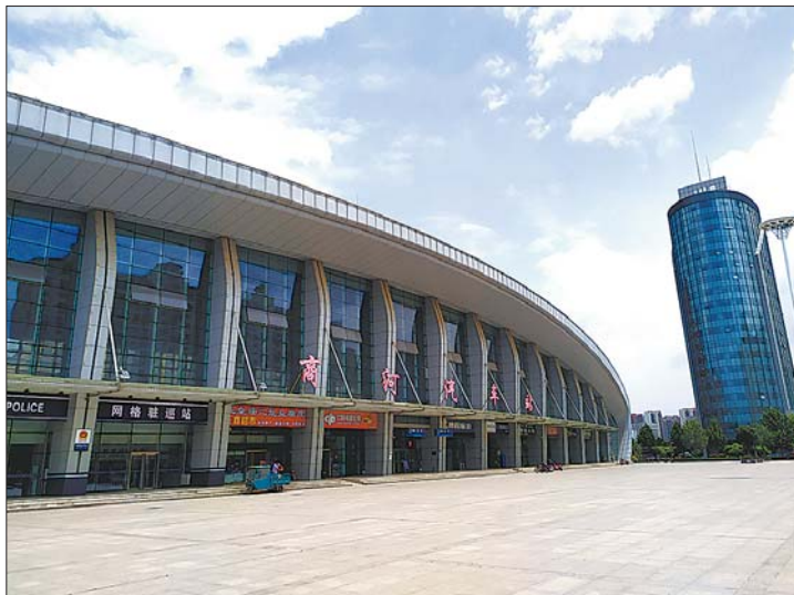
商河县长途汽车站。