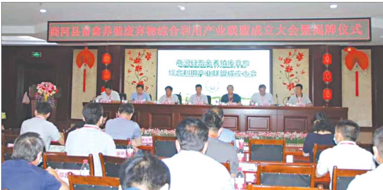
商河县畜禽养殖废弃物综合利用产业联盟成立。

为促进畜牧业高质量发展,商河县畜牧事业发展中心用好“重点项目”这个“金钥匙”,加快新型经营主体培育。围绕“高产、优质、高效、生态、安全”的总体要求,充分发挥现代畜牧示范园区和畜禽养殖标准化示范场引领作用,积极推进现代畜牧示范