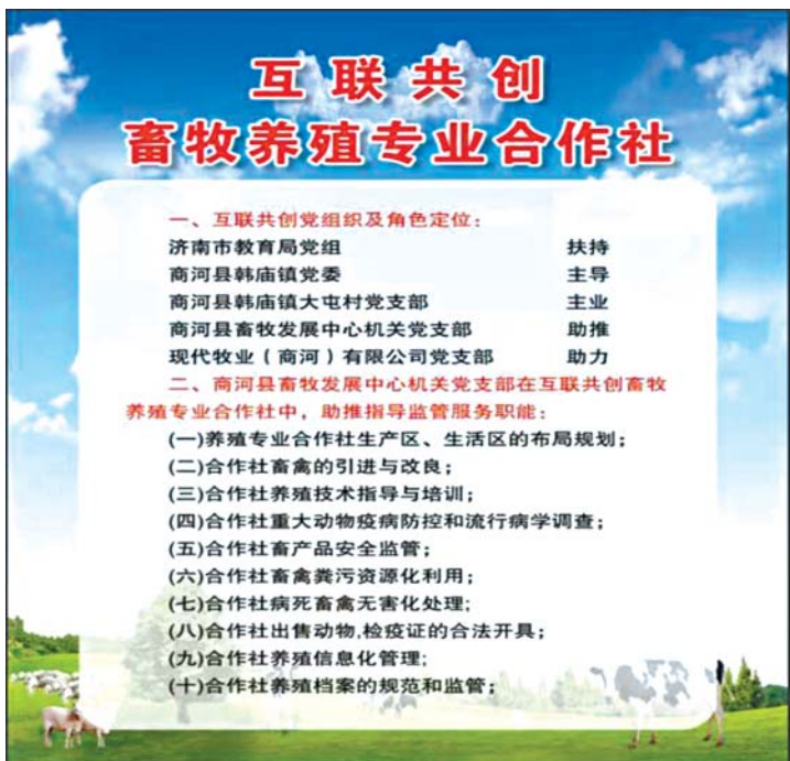
互联共创建立畜牧养殖专业合作社。