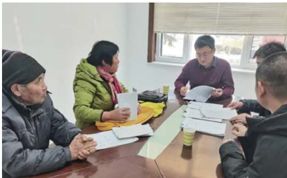
▲图为高村镇纪委协调第三方监理人员和群众见面，就工程质量存在问题进行现场答复。

近日，各镇街纪(工)委从堵塞制度漏洞、强化事前事中监督等方面入手，加大对工程领域违规问题的监督检查力度，全面推进“清廉村居”建设。