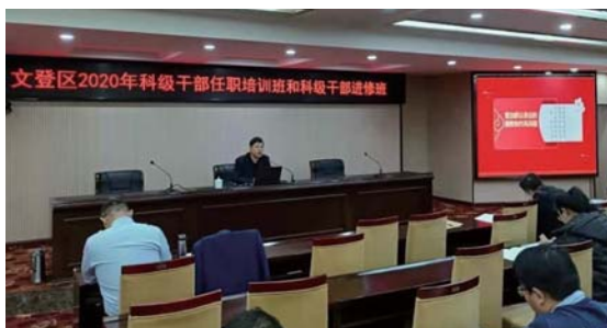
▲图为12月24日《群众身边腐败和作风问题警示教育》授课现场。