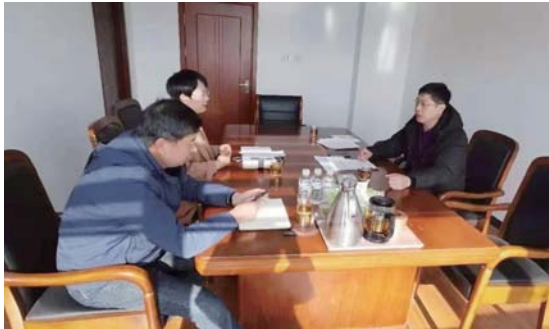
▲图为12月19日对侯家镇党委进行督导。

近日，文登区纪委监委班子成员分别带队深入基层，对工程领域有关问题自查自纠开展情况跟进督导检查。