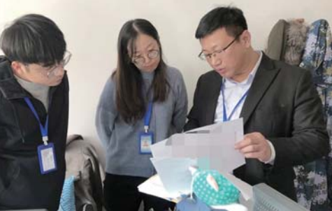
▲图为泽库镇纪委对审结案卷开展全面检查。