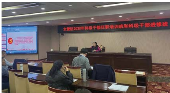
▲图为12月23日《党委(党组)落实全面从严治党主体责任规定》授课现场。

近日，文登区纪委监委有关班子成员到文登区2020年科级干部任职培训班和科级干部进修班开展党风廉政专题宣讲。