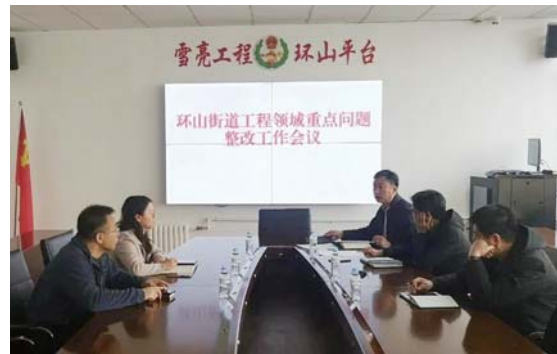
▲图为环山街道纪工委对工程领域违规问题整改工作进行调度，并对分管负责人进行约谈。