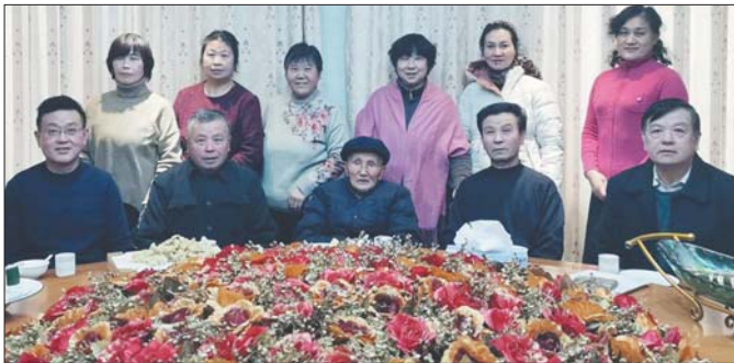
2020年12月31日,一家人齐聚陪老人迎新年。