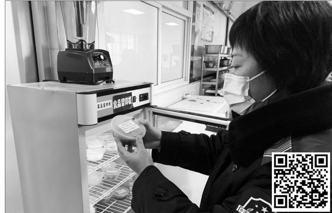
市场监管工作人员检查小餐桌食品留样。 扫码看视频。

对全市所有中小学校周边200米范围内食品销售点进行规范提升,全面推行校园周边食品安全网格化监管,校外托管机构规范化建设是2020年市政府为民办十件实事之一。截至2020年12月28日,济宁市校园周边200米范围内1507家食品销售者(含54家校园内食品销售者)、966家校外托管场所已全部纳入监管。