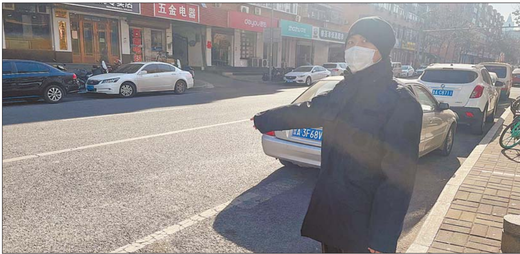
小郭指着他晕倒的地方,他要找到救助他的好心大哥。

身患疾病的小郭在济南住院一个月,1月7日,出院之后准备去大明湖转转,当他从一家商店出来突然晕倒在了街上。等小郭再醒过来时,发现自己身上披着一件大衣,并得知,有好心人给他交了3000元的医疗费后就离开了,这让他非常感动。1月8日,小郭找到壹点帮办记者,他想找到这位“救命恩人”,当面把钱和衣服还给好心人,并对他好好说一声:“谢谢。”