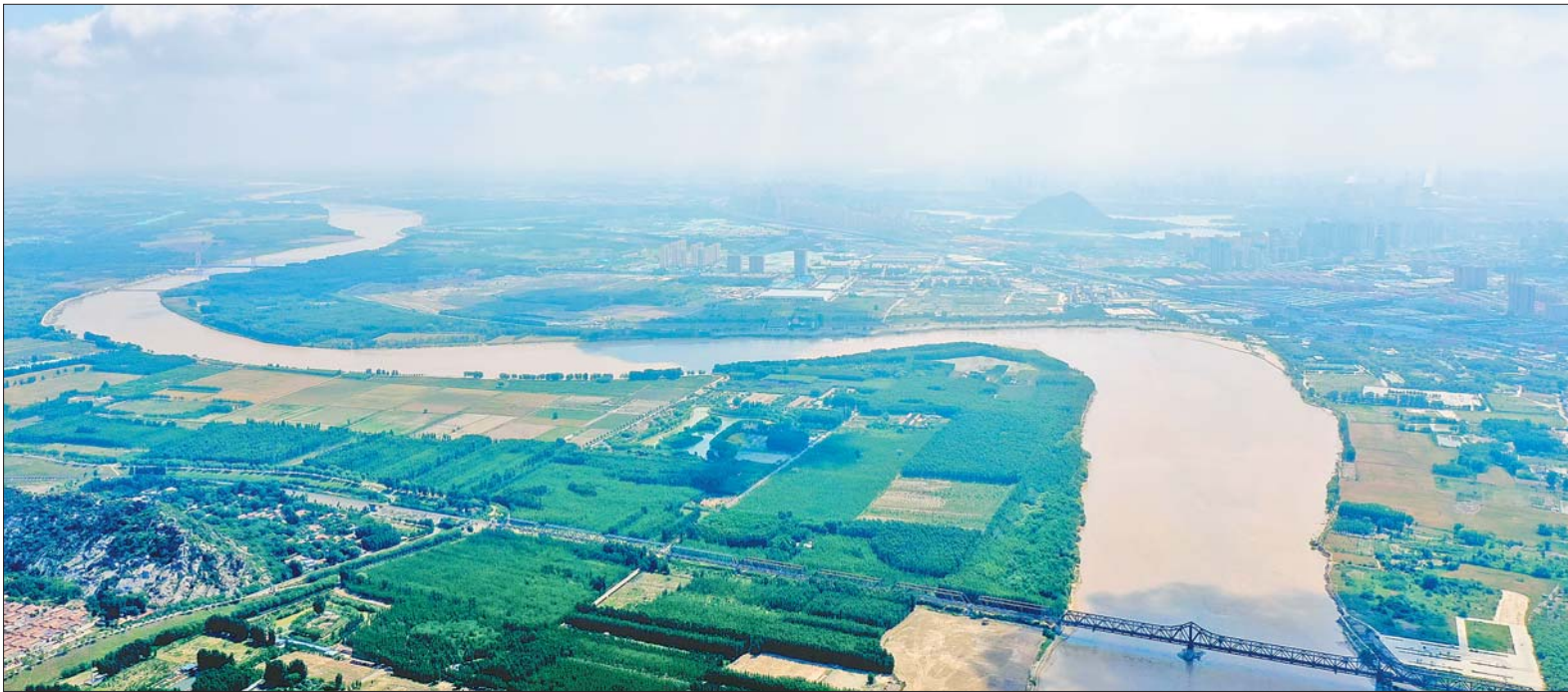
济南市政府工作报告把“推动新旧动能转换起步区全面起势”放到了今年十五方面重要工作的第二位。(资料片)