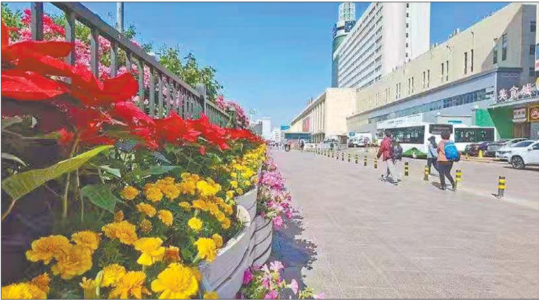
火车站综合整治提升后整体面貌明显改善。

此外,纬北路街道还坚持“破”“立”结合,以山钢·锦绣华府项目助力昔日的老厂区“破茧成蝶”。计划总投资约13亿元的济南