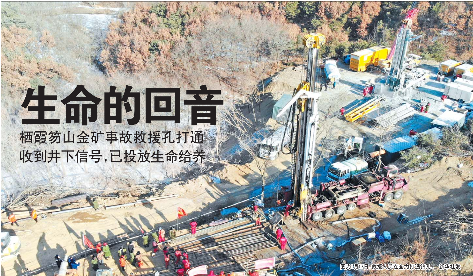
图为1月17日,救援人员在全力打通钻孔。

1月17日晚间,记者从栖霞笏山金矿爆炸事故救援现场了解到,经过紧张的下放套管作业,17日22时18分左右,3号钻孔开始投放给养。有手电筒、营养液、药品、纸笔等。为了不让温度太凉,营养液特意用温水烫过。100米,200米,300米,400米,460米,510米……消防队员稳稳地将钢丝绳向下放。拽了!拽了2下!拽了4下!22时46分左右,下方有人拽了钢丝绳。