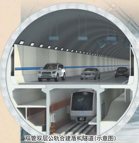
双管双层公轨合建盾构隧道(示意图)

4 打破天堑济南北跨加速 隧道建成后,济南城市中轴线穿黄北延,向北通达309国道、济南北部新城。打破天堑,北跨加速,济南新中心呼之欲出。