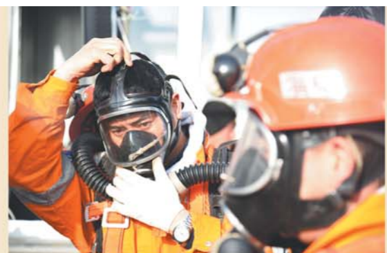
2 12日，救援人员在现场作业。当日，井下300米空气质量已经达标，救援吊桶已经到达井下180.5米。