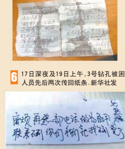
6 17日深夜及19日上午，3号钻孔被困人员先后两次传回纸条。