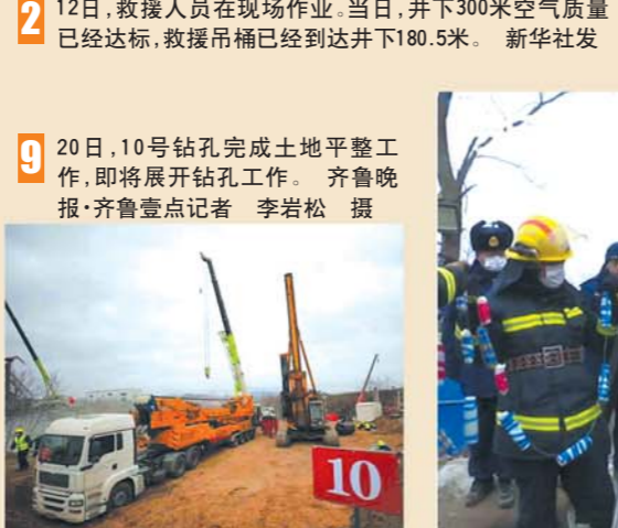
9 20日，10号钻孔完成土地平整工作，即将展开钻孔工作。