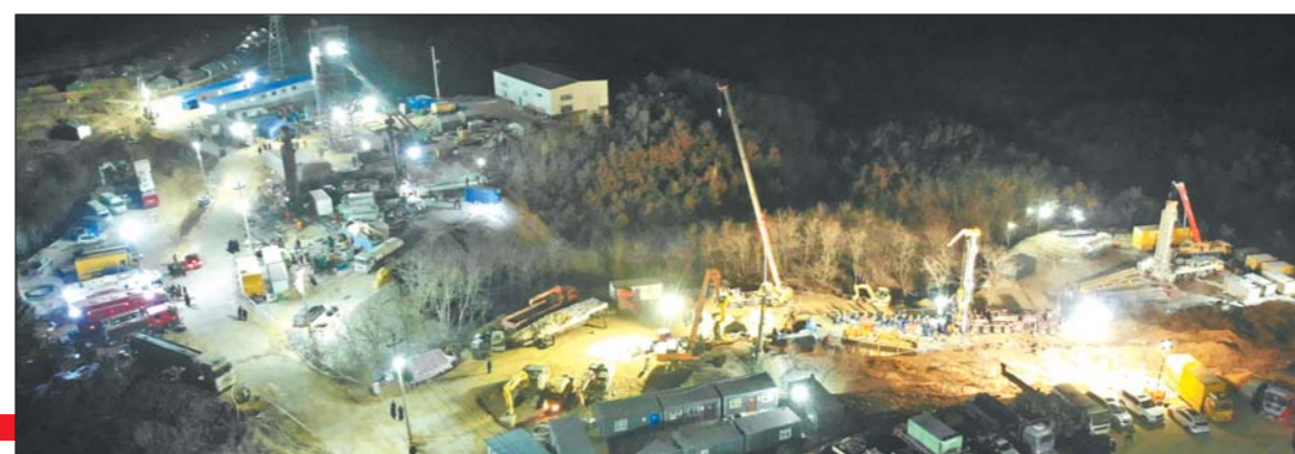
▲1月18日凌晨拍摄的救援现场，紧张的救援工作一刻也没停。

经过历时14天的漫长救援后，1月24日，烟台栖霞笏山金矿事故现场传来令人振奋的消息：当天新发现的1名被困人员和此前有联络的10名幸存被困人员悉数升井！ 11名被困人员升井，是生命的奇迹，也是救援工作不抛弃、不放弃的结果。十多天来，井上井下一直通力合作守护生命的希望，被困人员展现出了超强的坚韧，救援工作也一直在与时间赛跑，同死神竞速。在困境中齐心协力的坚持，换来让人激动不已的欣慰：平安。 11人重见天日，但救援工作还没结束。除此前已确定没有生命迹象的1名被困人员外，目前还有10人处于失联状态。已发现的被困人员升井后，救援人员已开始继续搜救。