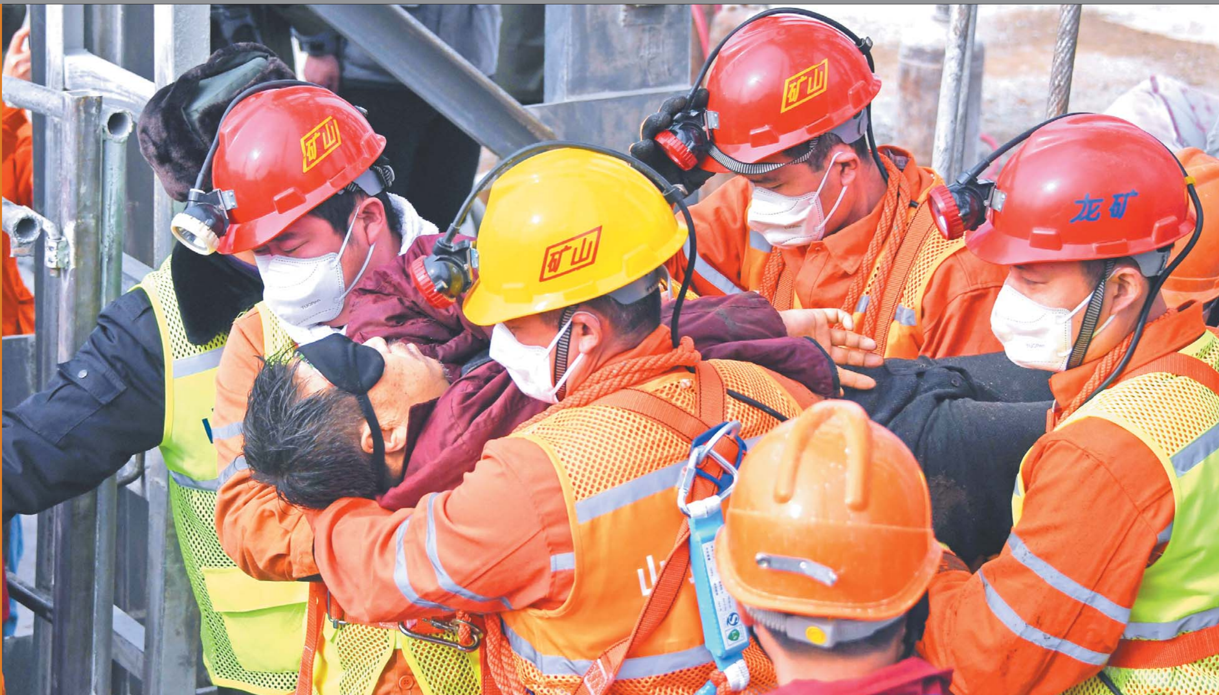
▲1月24日，一名被困矿工成功升井。当日，烟台栖霞笏山金矿事故应急救援指挥部救援人员通过回风井陆续将“四中段”和“五中段”的11名被困矿工救出。 新华社发

经过历时14天的漫长救援后，1月24日，烟台栖霞笏山金矿事故现场传来令人振奋的消息：当天新发现的1名被困人员和此前有联络的10名幸存被困人员悉数升井！ 11名被困人员升井，是生命的奇迹，也是救援工作不抛弃、不放弃的结果。十多天来，井上井下一直通力合作守护生命的希望，被困人员展现出了超强的坚韧，救援工作也一直在与时间赛跑，同死神竞速。在困境中齐心协力的坚持，换来让人激动不已的欣慰：平安。 11人重见天日，但救援工作还没结束。除此前已确定没有生命迹象的1名被困人员外，目前还有10人处于失联状态。已发现的被困人员升井后，救援人员已开始继续搜救。