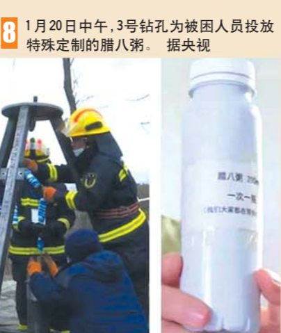
8 1月20日中午，3号钻孔为被困人员投放特殊定制的腊八粥。 据央视