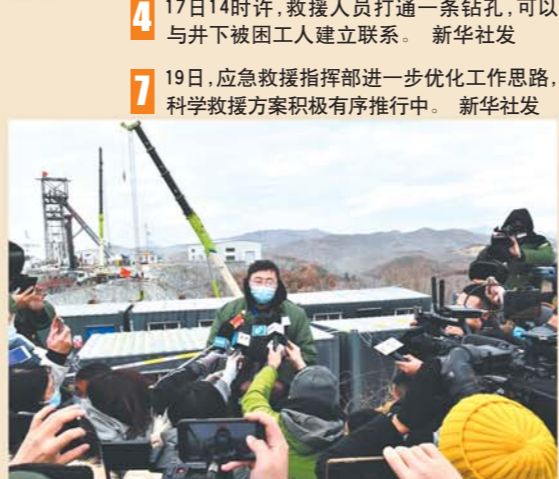
7 19日，应急救援指挥部进一步优化工作思路，科学救援方案积极有序推进中。