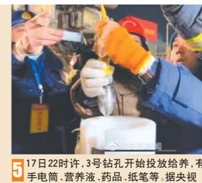
5 17日22时许，3号钻孔开始投放给养，有手电筒、营养液、药品、纸笔等。 据央视