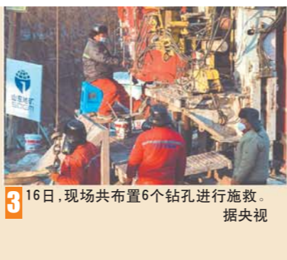
3 16日，现场共布置6个钻孔进行施救。 据央视