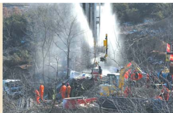
4 17日14时许，救援人员打通一条钻孔，可以与井下被困工人建立联系。