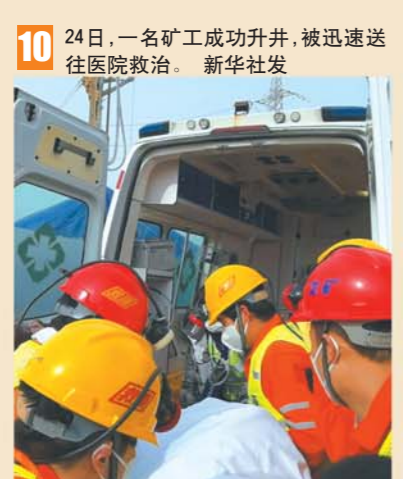
10 24日，一名矿工成功升井，被迅速送往医院救治。