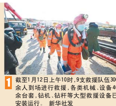
1 截至1月12日上午10时，9支救援队伍300余人到场进行救援，各类机械、设备40余台套，钻机、钻杆等大型救援设备已安装运行。