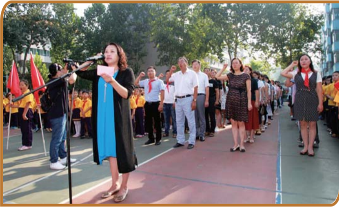
每学期开学进行师德宣誓。

打造“一校一品”党建特色文化品牌。各学校积极探索“一校一品”的路径和机制,努力形成植根教育教学、具有时代特征、彰显学校特点的党建文化品牌。任城区教育和体育局机关“党建领航·立德树人”党建品牌被评为区基层党建工作创新案例;东门大街小学“党旗映彩虹 师生共成长”、永丰街中心小学“礼仪花开党旗红”、兴东小学“党旗引领成长 匠心铸就幸福”、和平街小学“筑坚强堡垒 树先锋形象”和运河实验小学“争做先锋 传承文化”等5个党建品牌被评为市级“一校一品”党建文化品牌;其他学校党组织也积极探索学校党建工作的新途径、新模式、新举措,使党建工作更加丰富、更加完善、更加贴近实际。其中,十三中“德心育桃李·卓越党旗红”、南池小学“社区共建 廉开南池”、文昌阁小学“让优秀传统文化在党旗旗下弘扬”等品牌也是有声有色,可圈可点。这些举措顺应了形势,彰显了责任,不仅为学校党建工作增加了亮点,而且有效地提升了学校办学品位。