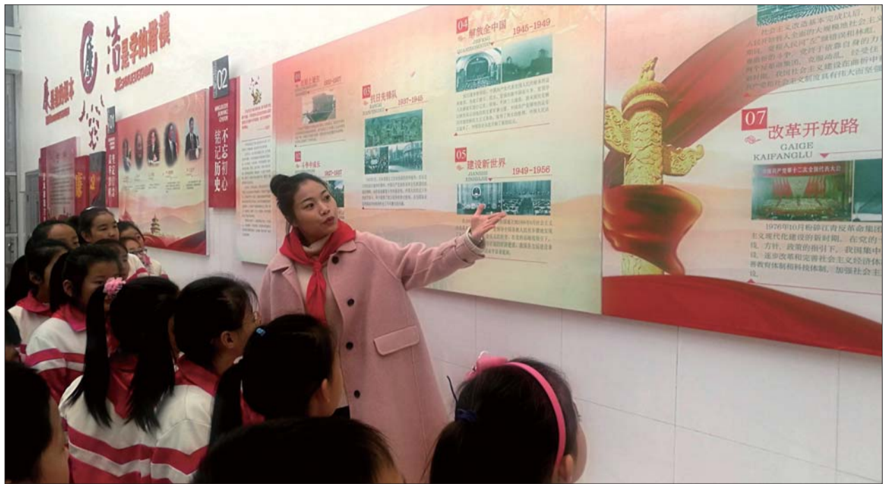
爱国主义教育遍及校园内外。

2020年,在济宁市委教育工委的正确指导下,任城区委教育工委提高政治站位,牢记为党育人、为国育才使命,不忘立德树人初心,坚持党对教育工作的全面领导,确立“党建领航·立德树人”书记突破项目,扎实推进思想政治建设、意识形态、组织建设、干部队伍建设和党风廉政建设等各项工作,统筹推进党建工作和业务工作深度融合,打造了一批值得复制和推广的党建工作典型。