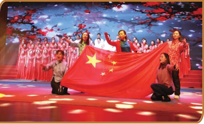
党员教师深情演唱《绣红旗》。