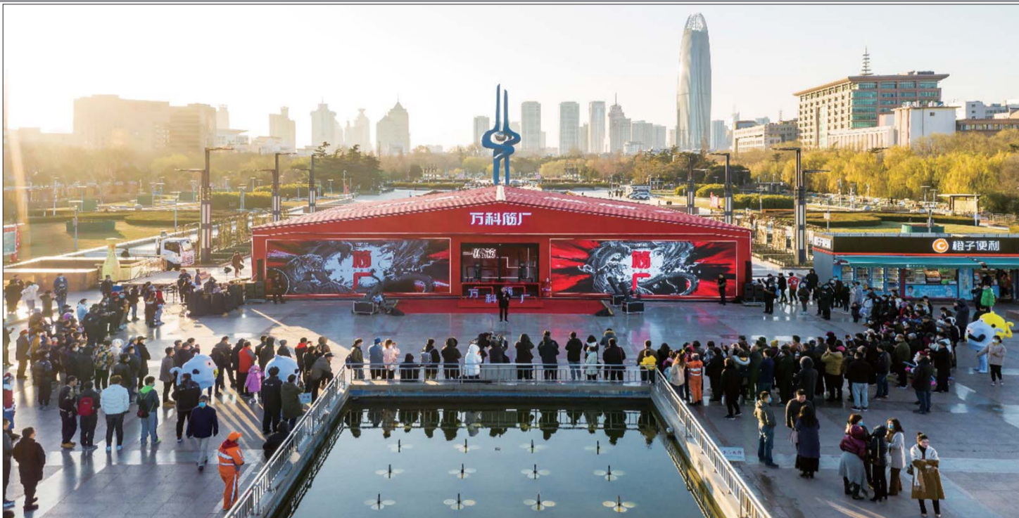
济南万科筋厂泉城广场开业仪式