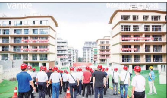
钢结构装配式住宅技术交流-如园项目参观