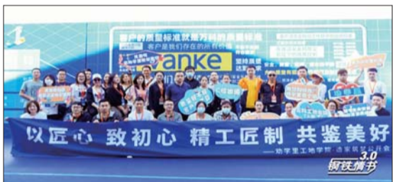
“钢铁情书3.0-工地学院”劝学里工地开放