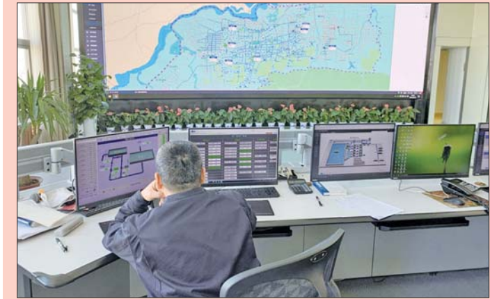
生产调度员时刻关注从水厂到管网的细微变化。