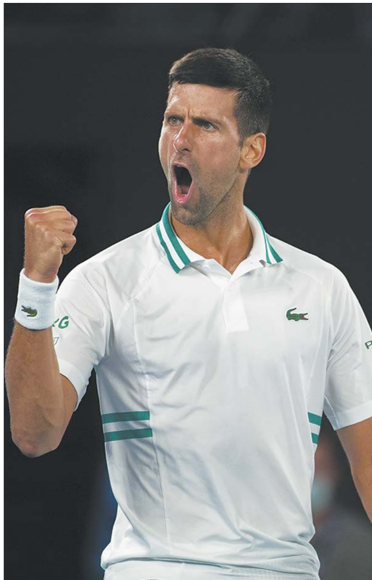
小德依旧渴望澳网的最高荣誉。