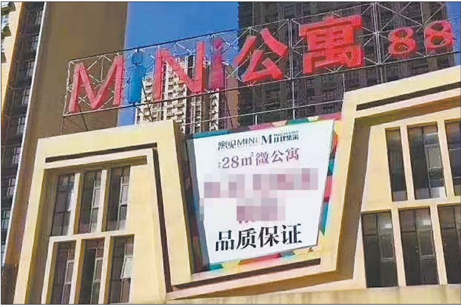
2018年,鹤华天禧宣传带有“MINI公寓”字样。