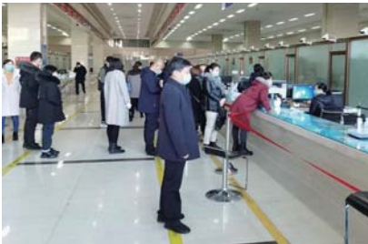
▲图为派驻第二纪检监察组到文登区政务服务大厅检查工作纪律。

为有效纠治机关干部“节后综合症”,防止“收假不收心”,各派驻纪检监察组对文登区各单位公车使用、禁酒令执行、上班到岗等情况进行突击检查,严厉“庸懒散”“正月慢”等作风问题。