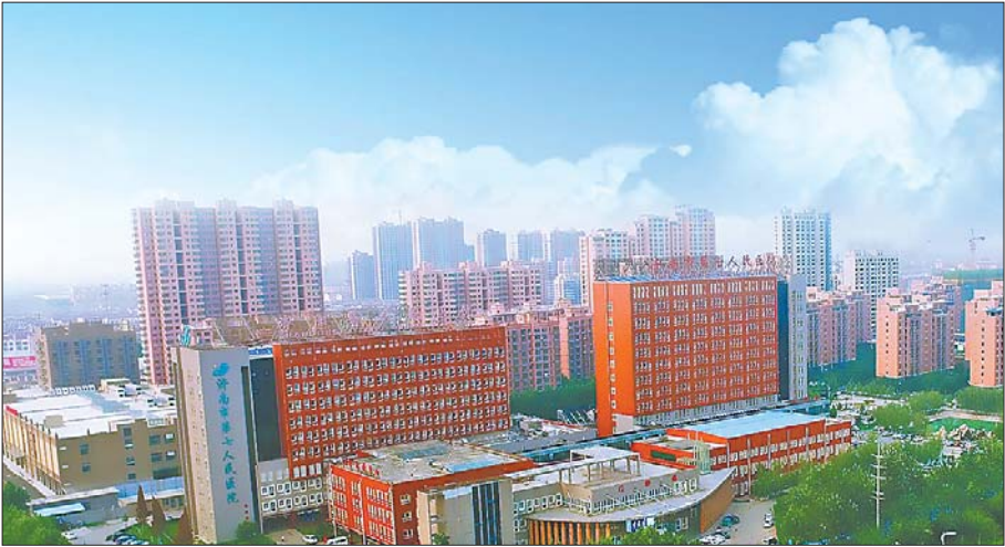
济阳区人民医院外景。