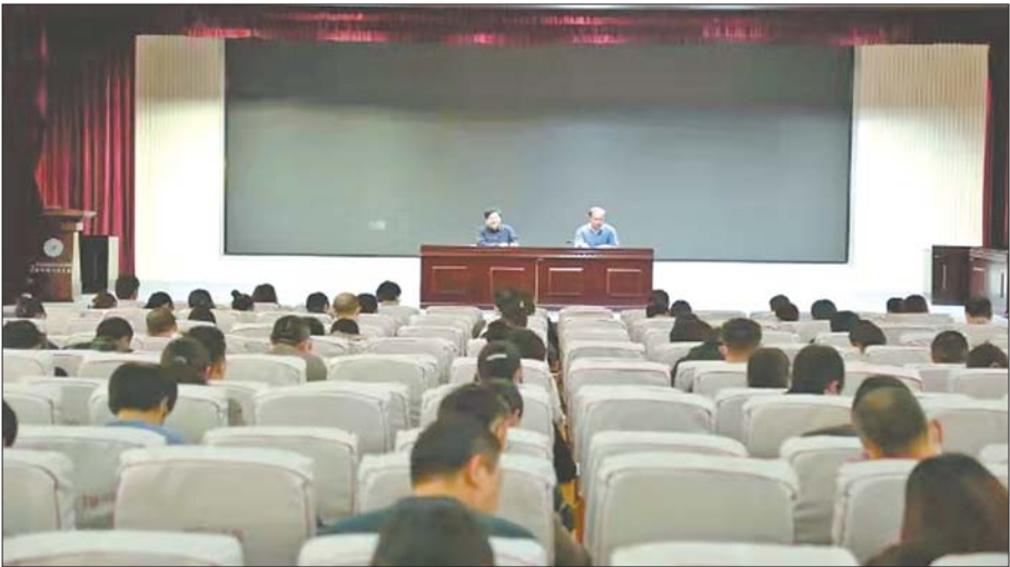
济阳区人民医院召开2021年工作部署会。

市、区各级政府要求贯彻执行，提高站位，狠抓落实，以核酸检测为抓手，做好院内感染和疫情防控工作。2.妇儿医院楼建成启用，医养楼主体完工。抓住机遇，挂图作战，加快妇儿医院建设，确保7月1日前投入使用，为建党100周年送上大礼；同时，做好区重点工程一医养楼的建设，计划建筑面积13200平方米，开设床位300张，争取年底主体楼完工。3.创建三级医院。明确责任，细化分工，狠抓落实，力争完成三级医院创建，全面提升医院综合实力，为建设北部中心城区区域性医疗中心奠定坚实基础。4.医共体建设取得新突破。以提升基层服务能力、全面落实分级诊疗为重点，建立和完善医共体管理体制、运行机制和激励政策，提高医共体内医疗资源配置和使用效率；以信息化为抓手，加强医共体建设，做好医共体内部信息系统建设与互联互通，建立远程会诊和影像、心电等远程诊断中心，逐步实现远程协作、资源共享。5.加强医院文化建设。坚持正面宣传、典型引导，弘扬主旋律，传播正能量。举办形式多样的文体活动，增强团队力量，树立新风正气，增进和谐发展。继续推行读书分享和素质培训，倡导人文精神，提倡人文关怀，提高人文素养。6.实现精细化管理转型。引进精细化管理模式，使各项流程更加精细、科学、规范和通畅。调整绩效分配方案，调动干部职工积极性。