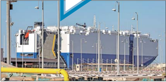
这是2月28日在阿联酋拍摄的以色列货船“埃利奥斯·雷伊”号。 新华/法新

面对美国新政府重新校准美沙、美以关系,以及寻求重返伊核协议,以色列必须强化伊朗的地区安全威胁者角色,限制美国中东政策回调,筑牢与海湾阿拉伯建交国搭建起的反伊朗阵线。