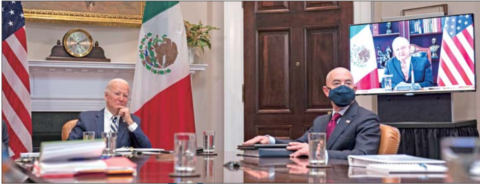
3月1日,拜登在白宫与墨西哥总统洛佩斯视频会晤。

克里斯托弗·雷是拜登上台后获得留任的重要高官,而美国本土恐怖主义案件数量翻倍,恰恰发生在特朗普任内。这再次证明特朗普那些极端、富有民粹色彩的言行,撕裂和破坏了美国社会。