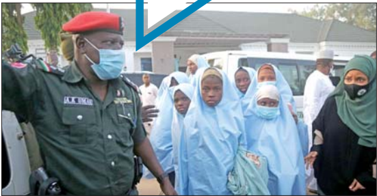
3月2日,尼日利亚扎姆法拉州获释的被绑架学生。

以往针对学校的袭击多由极端组织“博科圣地”发动,主要在尼日利亚东北部,近来以索取赎金为目的的绑架在该国中部和西北部频发。2月26日的袭击是3个月内发生的第三起群体绑架事件。