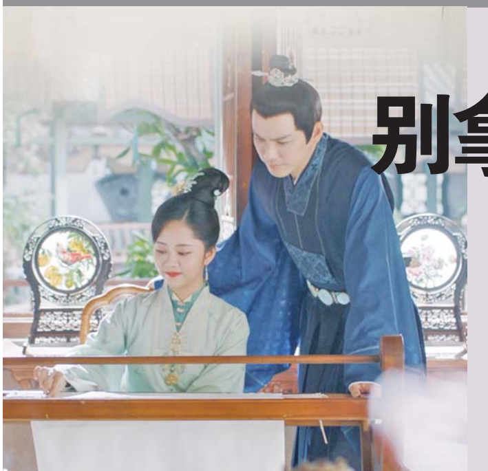
由谭松韵、钟汉良主演的女性励志古装剧《锦心似玉》上线首周播放量就突破10亿。观众一边看女主成长，一边嗑着“体面夫妇”的糖，不免想起了题材类似的《知否知否应是绿肥红瘦》。不过，《知否》豆瓣评分7.8，《锦心似玉》只有6.4，差距实在不小。