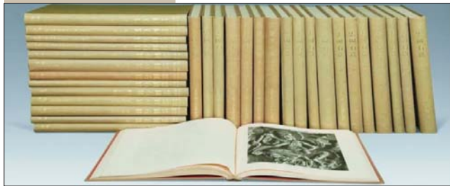
日本人出版的《云冈石窟》32本报告书。

在云冈研究院的带动之下，假如某一天，长江文明考古研究院进一步升格并推出长江学，我们不必感到吃惊。我们相信并期待着，未来在文物保护乃至传统文化领域会涌现出更多类似的机构与学问。