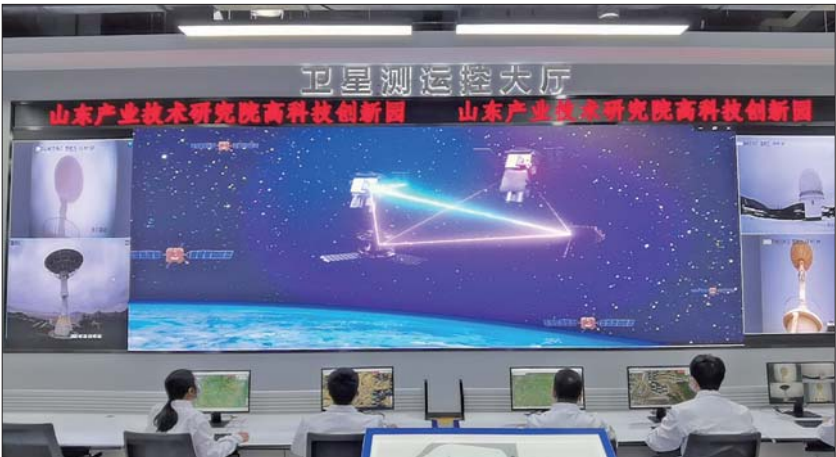
山东产业技术研究院致力于打造全省创新驱动发展核心引擎和制度创新的示范样板。(资料片)

“十四五”开局，一系列动作显示济南“1+6”都市圈一体化发展开始启动，济南是资源要素聚集地，这种国家级平台、国家级实验室和产业创新中心用得好了，会对都市圈内淄博、滨州、聊城、烟台等制造业企业产生辐射效应。作为都市圈核心城市，济南首先就是要进行体制机制的创新，打开资源阀门，让济南都市圈的资源流动起来，形成市场协同，共同把相关产业做大做强。