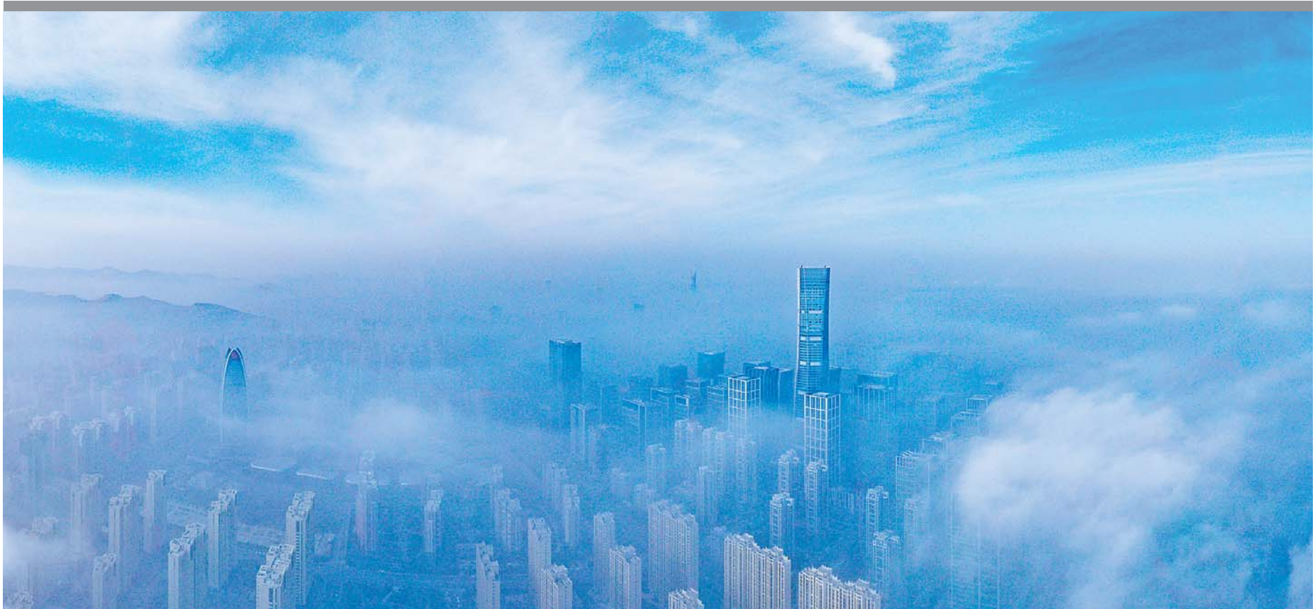
平流雾中的济南汉峪金谷。