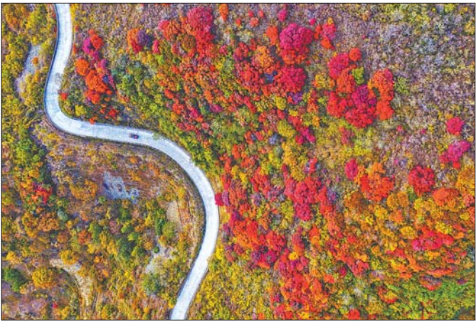
济南南部山区山路崎岖,一路秋色繁华。