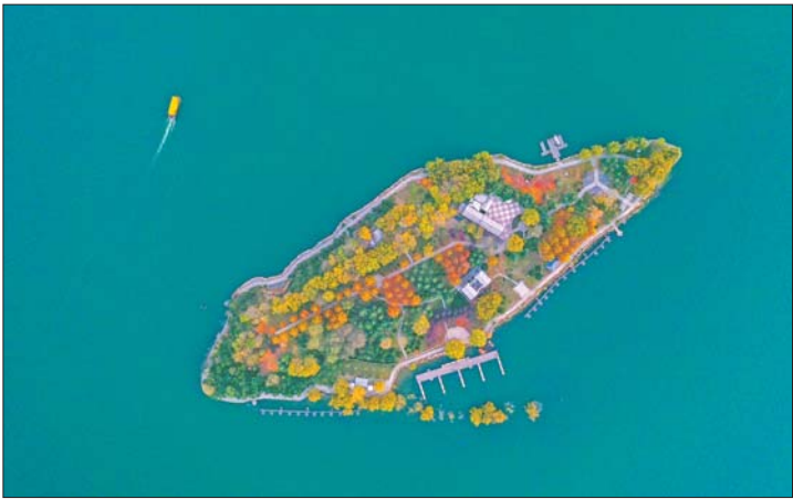
深秋时节,雪野风景区湖心岛宛如一片落叶。