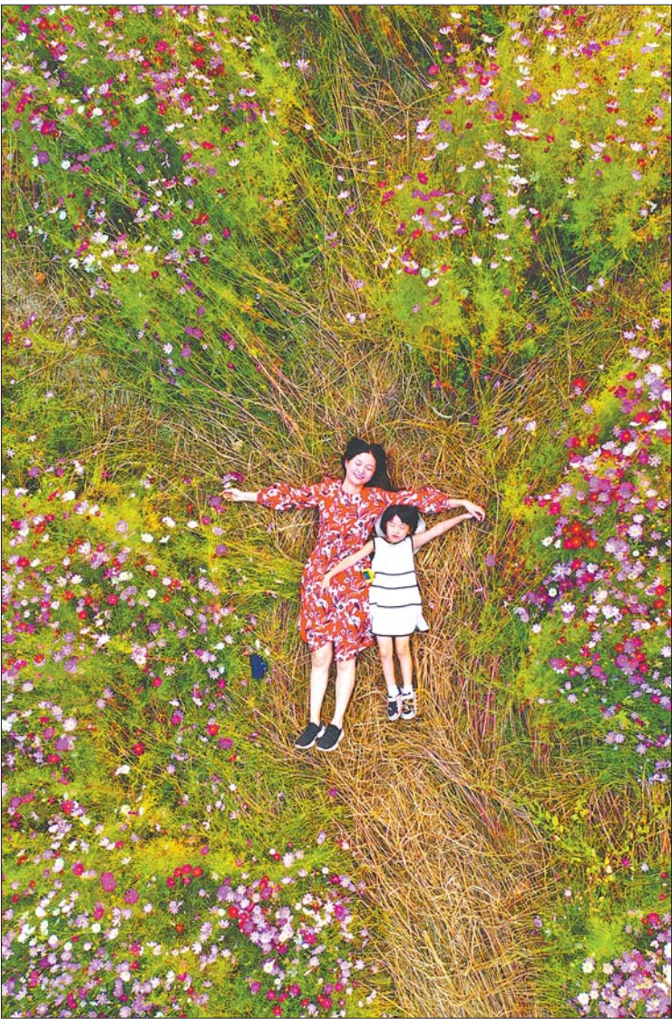
格桑花海中的一对母女。