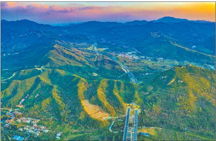
穿越崇山峻岭的“最美高速”济泰高速。